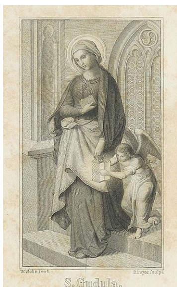
Ook op deze litho is Sint-Gudula weer vergezeld van een engel die haar lamp aansteekt.

Na haar dood gebeurden er meer wonderen. Gudula wordt begraven met kostbare kleding en sieraden. Een dief stal de kostbaarheden, waarbij hij zelfs een paar armbanden van Gudula's arm trok. Op zekere dag liep een dochter van de dief met die armbanden op straat. Iemand herkende ze en de vader van het meisje werd verhoord. Toen hij uiteindelijk bekende, sprak Gudula's broer Emebert de banvloek uit over de dief en zijn nakomelingen, waarbij de vrouwen een keelaandoening opliepen. Na haar herbegraving in Moorsel verplaatste de boom van haar oude graf zich naar de nieuwe plek.