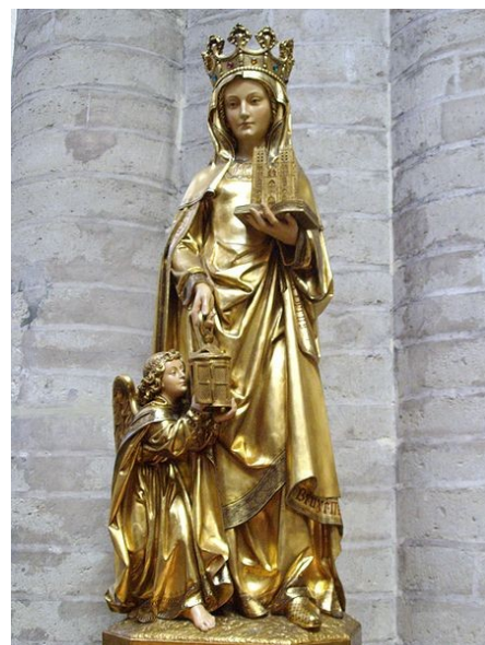
Vanwege het wonder van de steeds dovende en weer aangestoken lamp wordt Sint-Gudula meestal afgebeeld met een lamp; soms met een duiveltje dat de lamp wil uitblazen; hier met een engel die de lamp brandende houdt. Beeldje uit 1912 door M. de Beule (Brussel, Sint-Michiel & Gudula kathedraal).

Haar sterfdatum is 8 januari 712, vandaar de gedenkdag 8 januari. Ze werd begraven op het landgoed Ham; niet het oude familiegoed, maar Ham bij Assche, waar ook haar broer Emebert woonde. In 988 is Gudula's lichaam overgebracht naar de kerk van Sint Gorik bij Brussel en in 1047 naar de kerk van Sint-Michiel in het centrum van Brussel. Daarom is deze kathedraal later gewijd aan Goedele en Michiel. Goedele werd ook de patrones van de stad Brussel. Bij de beeldenstorm in 1579 zijn haar relikwieën verloren gegaan.