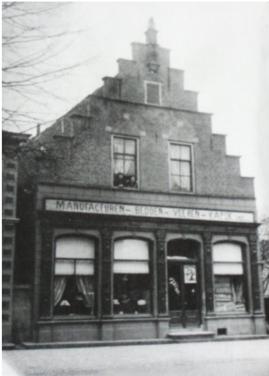
Het pand Bierstraat 2 of Markt 1 is een van de oudste bestaande huizen van Lochem en was oorspronkelijk het Richtershuis, waar lokaal recht werd gesproken. De naastgelegen steeg heette de Rigter Steeg. In de twintigste eeuw diende het pand onder andere als manufacturenwinkel, kunsthandel, Nutsspaarbank (waardoor de steeg Spaarbanksteeg ging heten), openbare bibliotheek en raadzaal.

Later, in 1491 blijkt het in Lochem juist een probleem om drie vrouwen als heks te veroordelen zonder dat ze zelf bekend hebben. Ze zijn al opgesloten in de Blauwe Toren. De drossaard van Zutphen stuurt een scherprechter, maar zijn martelingen leveren geen bekentenis op. Het gekerm is ver buiten de Blauwe Toren te horen, maar de vrouwen ontkennen enig verbond met de duivel. Burgemeester en schepenen van Zutphen kunnen niet tot een conclusie komen en leggen hun dilemma voor aan het stadsbestuur van Keulen. De brief waarmee ze dat deden is bekend, het antwoord helaas niet.