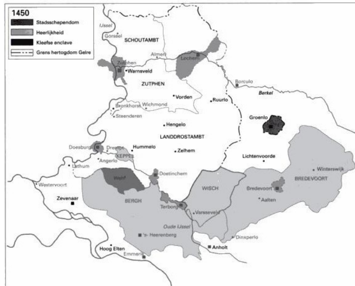
Indeling (land)drostambt, schoutambten en richteramten in het Graafschap Zutphen rond 1450.

Verantwoordelijk voor de rechtspleging in het hele Graafschap Zutphen was de landdrost of drossaard in Zutphen, die belangrijke zaken, zoals halsmisdrijven, zelf behandelde. Voor het grondgebied van het scholtambt Lochem waren burgerlijke geschillen en minder belangrijke misdrijven gedelegeerd aan de stedelijke schout. Almen en Gorssel hadden aparte richteramten binnen het scholtambt Zutphen.