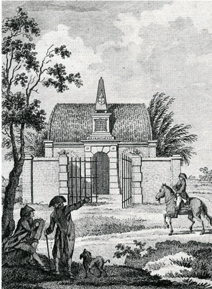
Het familiegraf aan de rand van de GORSSELSE HEIDE (25).