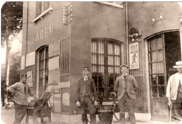
Vanaf Halteplaats Laren-Almen werden landbouwproducten en vee getransporteerd. Bij het station was een varkenswaag, waar varkens werden gewogen voor het transport per trein. Ook werden vanaf hier vaatjes met 'Larensche roomboter' vervoerd naar Lochem en Zutphen.

nog steeds. Beide werden in 1865 geopend en de loop van beide sporen werd beïnvloed door grootgrondbezitters. De bewoners van huis 't Joppe en die van huis Ampsen stelden alleen grond ter beschikking als er een station dicht bij hun huis kwam te liggen. Dat verklaart waarom station Lochem zo ver van de stad ligt en het tot 1938 in gebruik zijnde station Gorssel zo ver van het dorp.