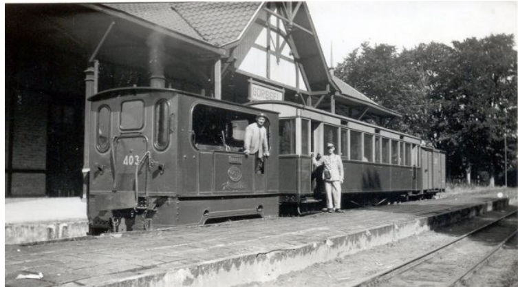
–Het tramhuisje in Gorssel, onderkomen van de Oudheidkundige Vereniging de Elf Marken.