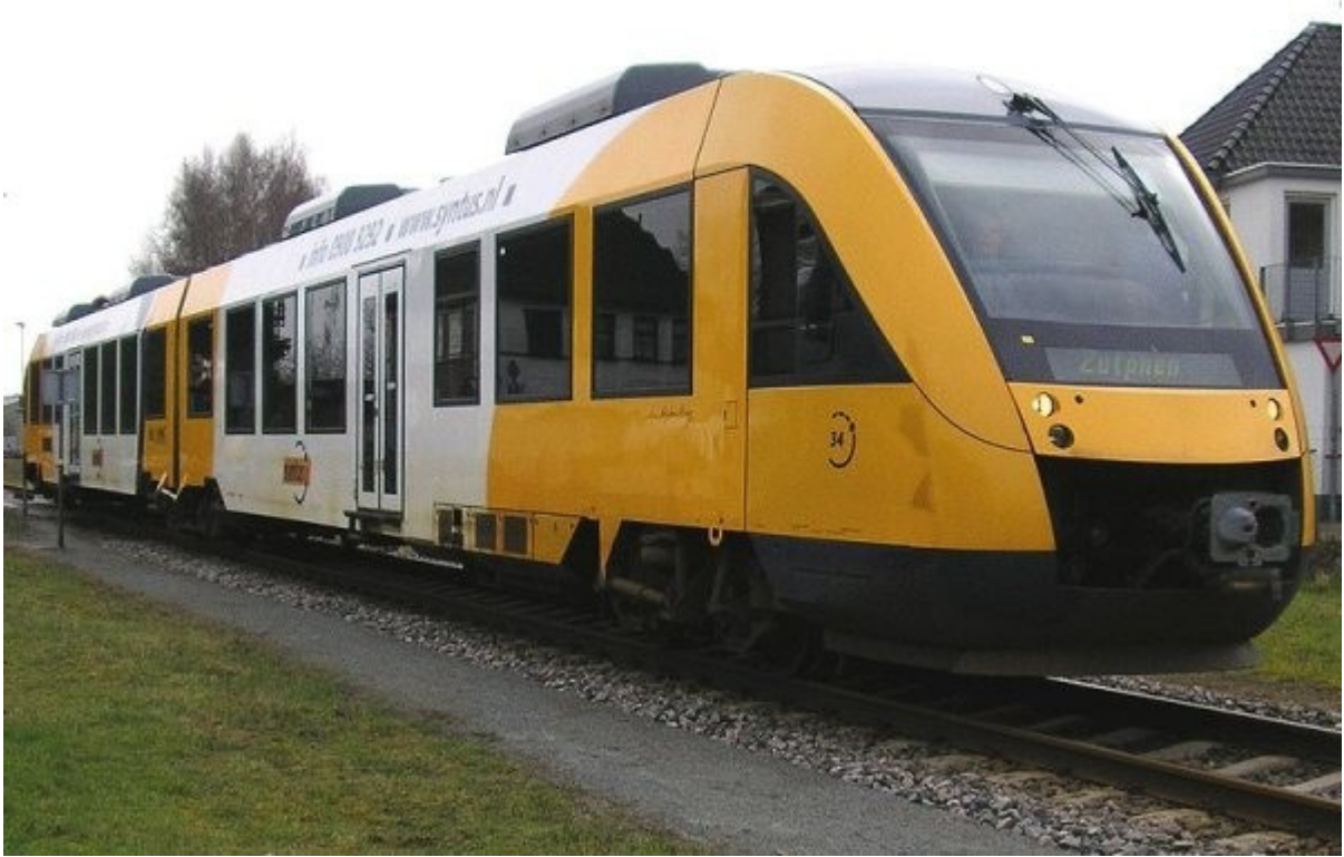
In 2010 onderhoudt Syntus het vervoer tussen Achterhoek en Twente met lichtgewicht rijtuigen van het type Lint-41.

Na de oorlog werd alle regionale reizigersvervoer uitgevoerd met bussen. De Geldersche Tramwegen GTW werd Gelderse streekvervoer maatschappij GSM en ging vervolgens op in de onderneming Syntus, die op elkaar afgestemde bus- en treinverbindingen ging onderhouden.