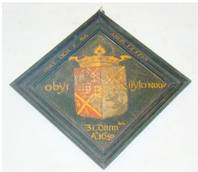
Rouwbord in de kerk van Batenburg