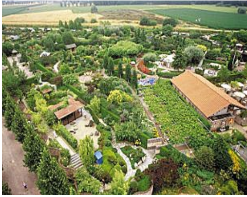
Tuinen van Appeltern

Over kleine weggetjes met mooie landschappen en riviergezichten kwamen wij langs de Tuinen van Appeltern en het huis Appeltern bij de Maas. Het huis is bekend als eigendom van de Patriot Joan Derk van der Capellen (1741 -1784). Hij verzette zich als politicus in de tijd van de Republiek der Verenigde Nederlanden tegen machtsmisbruik en de behandeling van de burger als een onmondige. Hij ijverde voor de afschaffing van de drostendiensten, waarbij boeren een aantal dagen per jaar voor bijna niets werkten op het land van een lokale bestuurder.