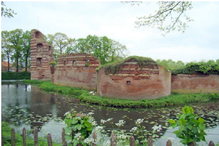
Ruïne van Batenburg

Ook steunde hij de Amerikaanse revolutionairen in hun onafhankelijkheidsstrijd tegen Groot-Brittannië. Hij schreef onder andere het beruchte anonieme pamflet tegen stadhouder Willem V: “Brief aan het Volk van Nederland”(1781). Ondanks zijn zwakke gezondheid, tegenwerking en teleurstellingen heeft hij zich met verbazingwekkende, doelgerichte energie ingezet voor democratische vernieuwingen. Tien jaar na zijn dood (1794) verjoegen Nederlandse patriotten met behulp van Franse troepen het orangistische bewind en stichtten de Bataafse Republiek. Hella S. Haasse heeft aan de hand van authentieke tijdsdocumenten een kroniek samengesteld getiteld “Schaduwbeeld of Het geheim van Appeltern”(biografische roman) waaruit een beeld ontstaat van Nederland in een minder bekende periode, te midden van landen in grote beroering.