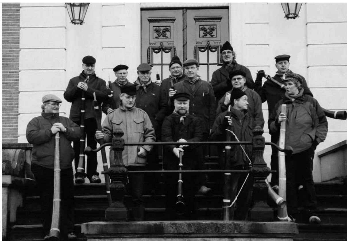
De Lochemse midwinterhoorngroep op het bordes van Huis Verwolde, Laren, 6 januari 2008.