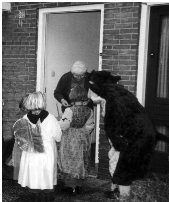
Sint-Maarten (Uit: Tradities rond Oud en Nieuw - Dinie Hiddink)

“Sinte-Maarten is zo koud, Geef een turfje of wat hout, Om hem te verwarmen”