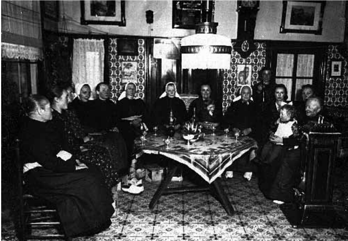
Nieuwjaarsvisite (Uit: Tradities rond Oud en Nieuw - Dinie Hiddink)

“Heil en Zegen” toe en geef aan Vader en Moeder den berijmden zegenwensch, dien we in school geschreven hebben en dien ik zoolang stilletjes bewaarde. Bij het vlamvend haardvuur geniet ik van een “ölliekrabbe” oliebol met een kopje koffie.” Hij verhaalt verder dat ze naderhand de buurt ingaan om Nieuwjaar te wensen.