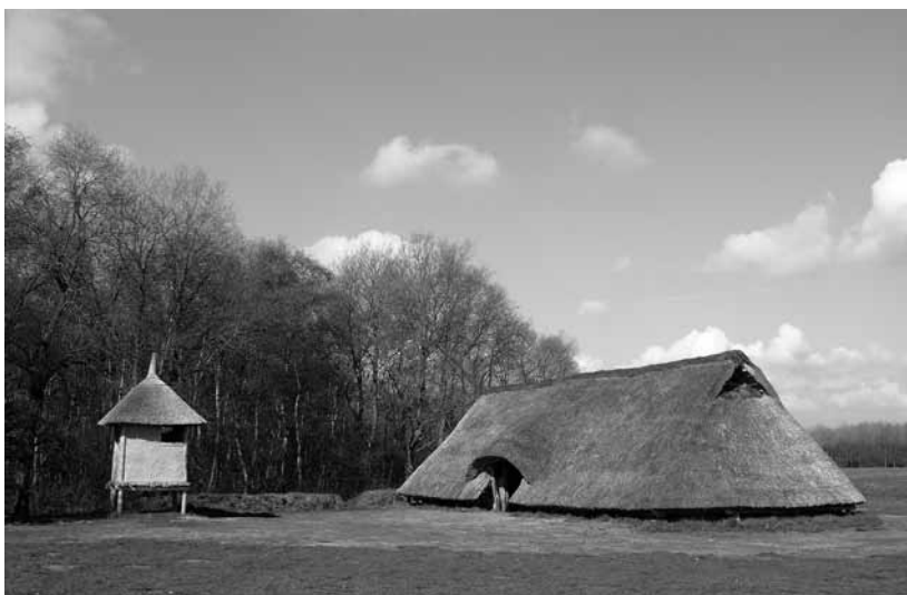
Op de foto van Staatsbosbeheer District Drents Loo & Aa staat een nagebouwd IJzertijdboerderijtje (3).

De boerderijen zijn ruim 22 meter lang en ongeveer 6 meter breed. Ze hebben twee ingangen tegenover elkaar gelegen aan de lange kant van het gebouw. Een deel van het gebouw is voor de stalling van het rundvee. Dit deel bevat met vlechtwerk afgezette veeboxen. Het andere deel is het woongedeelte met het haardvuur en de slaappleaatsen voor de bewoners.