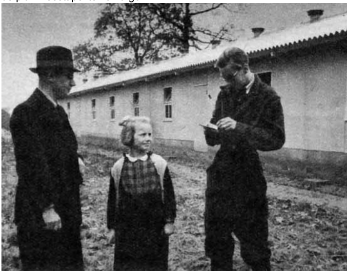
Land van Lochem 2011 nr. 2

De zestienjarige „bedrijfsleider” voor de loods, waarin duizendacht kippen hun leven slijten. Tweemaal een kwartier per dag werken is voldoende om de pluimveestapel te verzorgen.