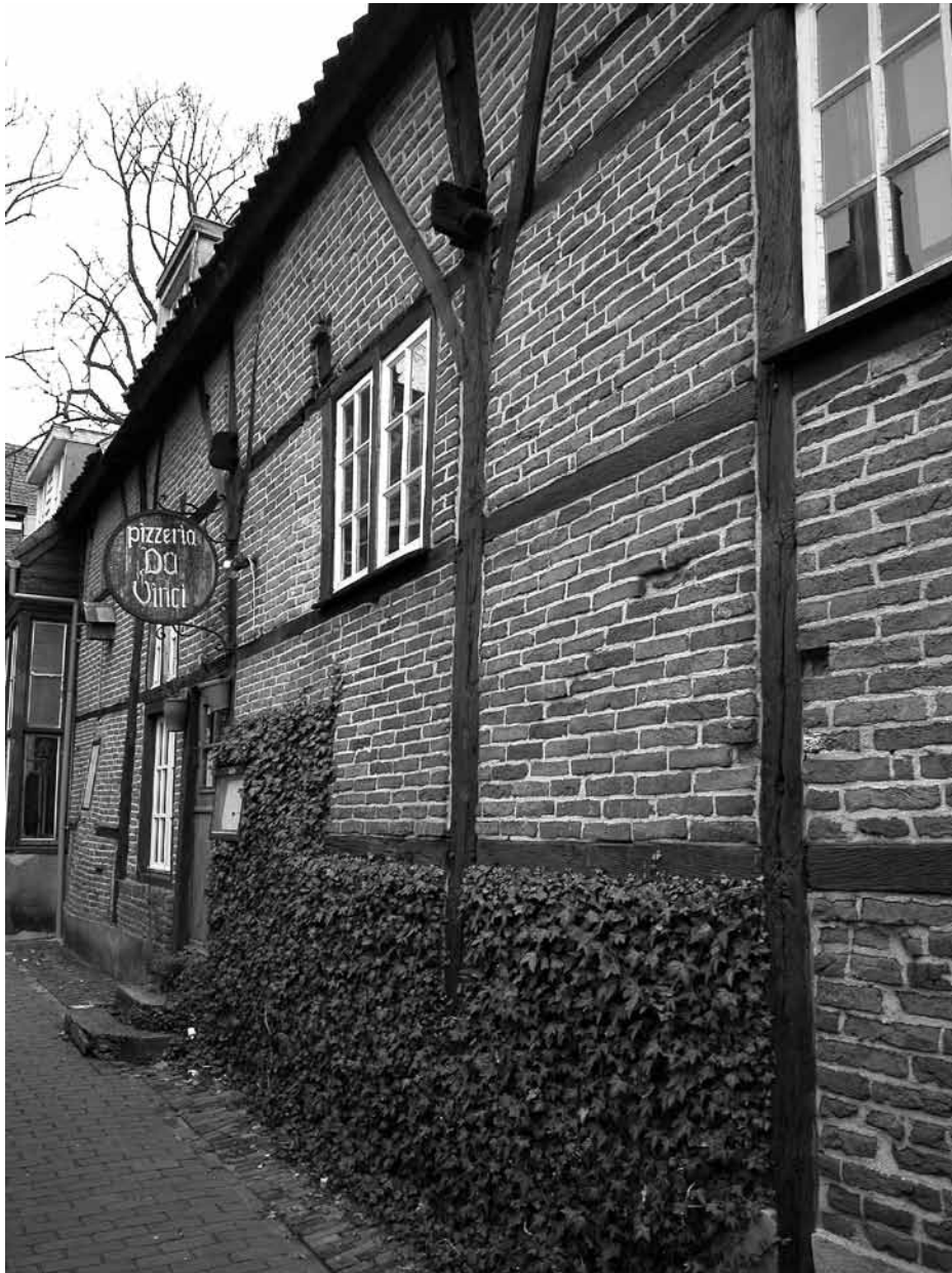
De historische vakwerkgevel aan de zijde van de Kerksteeg