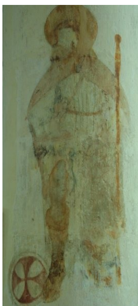
Een muurschildering op een pilaar in de Grote Kerk in Lochem toont Sint Rochus, met buil op zijn been. Het aanroepen van de heilige Rochus moest beschermen tegen de pest. Ook Sint Sebastiaan gold als afweerder van pest, lepra en zweren.

Builenpest werd veroorzaakt door een bacterie, verspreid via de zwarte rat. Wanneer een buil in het longweefsel doorbrak, kon een nog gevaarlijker vorm van pest ontstaan. Deze longpest was zeer besmettelijk, want overdraagbaar via hoesten, en vrijwel altijd dodelijk. De ziekte ging gepaard met hevige hartkloppingen, bloed ophoesten en ademnood. Uiteindelijk stikte het slachtoffer. Vaak besmette de bacterie het bloed. De inwendige bloedingen die dat veroorzaakte, kleurden de huid donker. Vandaar vermoedelijk de aanduiding "Zwarte Dood".