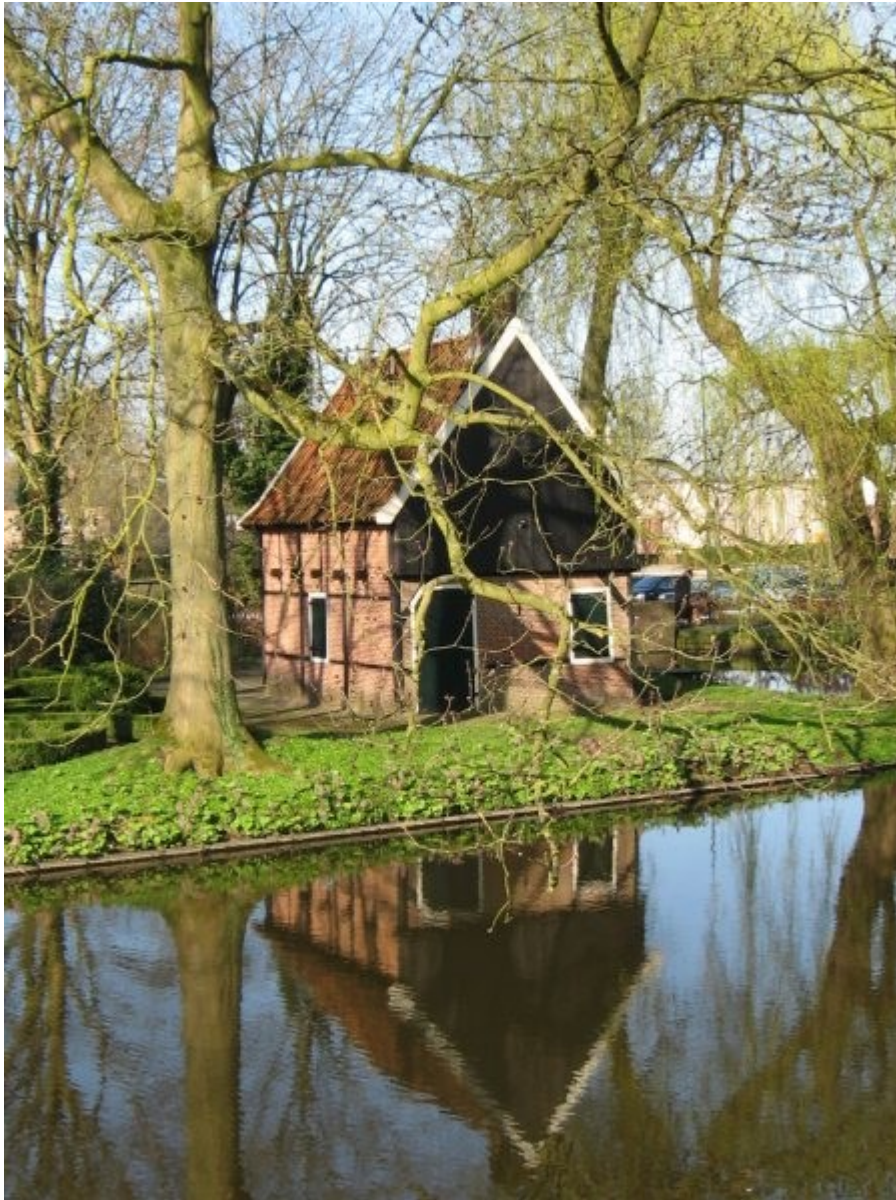
Het bleekhuisje op de Westerableek was en is gewoon een tuinhuisje voor gereedschappen, ook al is het soms aangezien voor 'pesthuisje'. Het geeft waarschijnlijk wel een goed beeld van het soort huisjes waarin men pestlijders kon afzonderen.