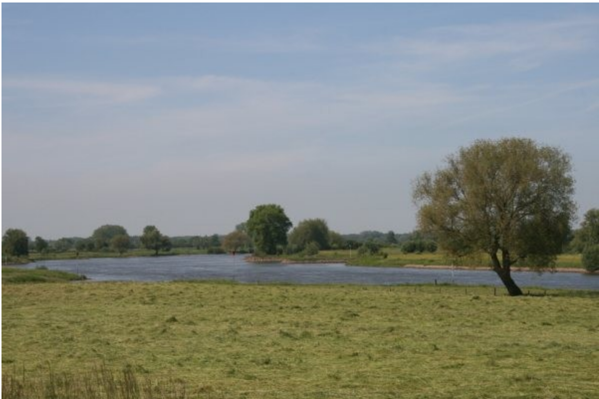
De IJssel bij Gorssel.

De beleving van dat IJssellandschap is onverbrekkelijk verbonden met Gorssel.