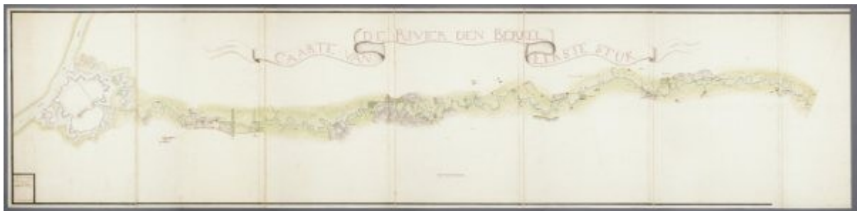
Caarte van de rivier den Berkel uit 1763 (Zutphen, Regionaal Archief).

De bloeitijd van de Berkelscheepvaart was de negentiende eeuw, toen er wel zo'n 200 Berkelzompen hebben gevaren. Na de aanleg van spoorwegen in de Achterhoek verdween deze scheepvaart. In 1905 voer de laatste Berkelzomp door de Borculose sluis.