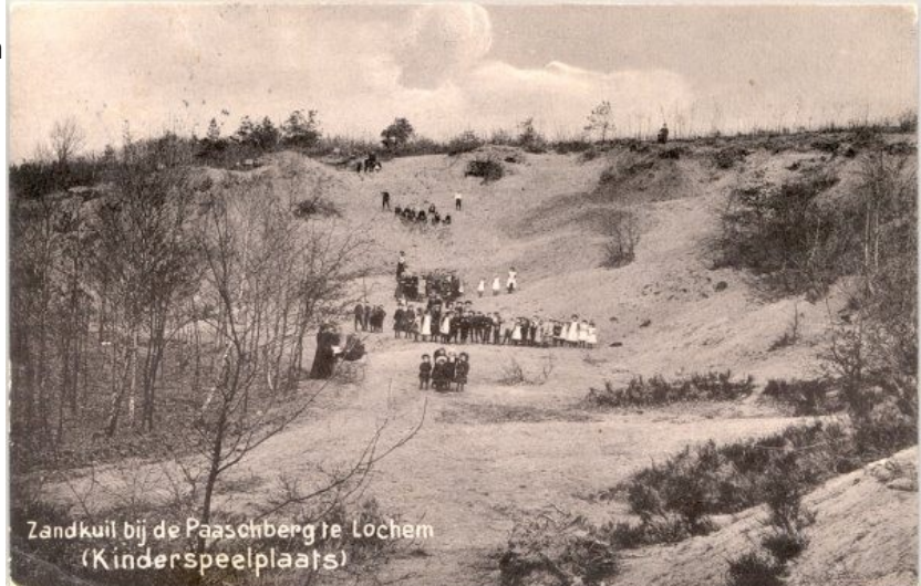
De Zandkuil toen het nog gewoon een zandkuil was.

Vanaf 1935 ontstonden bij de Vereniging Lochem Vooruit plannen voor een natuurtheater op die plek. Tien- tot elfduizend gulden zou de aanleg vergen. Merkwaardigerwijs maakte juist de crisis van de jaren 30 de aanleg mogelijk.