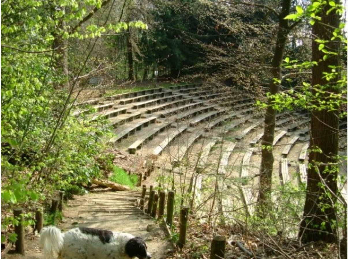
Het openluchttheater is niet alleen schouwtoneel, maar ook gewoon een mooie plek in het bos.

Toch moest de glorie van het theater toen nog komen. Tussen 1968 en 1986 vergaarde De Zandkuil landelijke roem door het jaarlijkse popfestival. De Popmeeting zou het eerste jaarlijks terugkerende festival van Nederland worden. Vele buitenlandse beroemdheden traden er op, maar achteraf misschien nog het meest opvallend is de geboorte van de groep NORMAAL (33) gebleken .