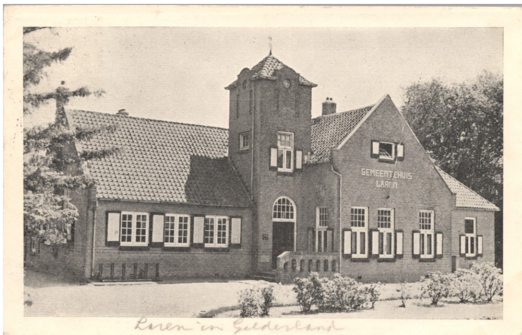
Het Larense gemeentehuis stond aan de Ampsensweg, vlak bij Lochem. Net als voor het nabijgelegen station (en de spoorlijn) werd voor dit gemeentehuis grond ter beschikking gesteld door de familie van Nagell van het landgoed Ampsen.

In 1831 is de Kring van Dorth weer samengevoegd met Gorssel, Verwolde hield het vol tot 1854 en ging weer bij Laren horen. In de Gemeentewet van 1851 is het onderscheid tussen stad en platteland definitief verdwenen. De stad Lochem kreeg eenzelfde bestuur als de omringende plattelandsgemeenten Gorssel en Laren. Laren viel ongeveer samen met het voormalige scholtambt Lochem, de stad Lochem grensde ten noorden en ten zuiden (Barchem en omgeving) aan de gemeente Laren.