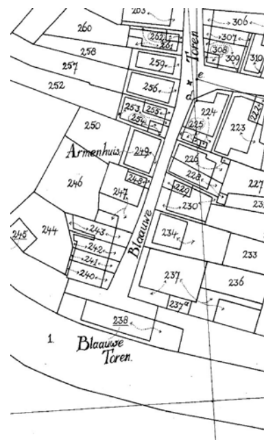
De Blauwe Toren op een plattegrond uit 1832

De Blauwe Toren stond destijds kops op de Blauwe Torenstraat tegen de gracht bij de Zuiderwal, daar waar nu een brug de Blauwe Torenstraat met de Burgemeester Leenstraat verbindt.