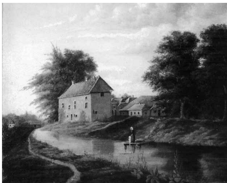
De Blauwe Toren door Gradus tenPas

Het is vooral zo uniek, omdat het een beeld geeft van het in 1881 gesloopte bolwerk de Blauwe Toren, geplaatst in zijn omgeving. Voor zover bekend is dit de enige afbeelding, waarop dit te zien is. Wel zijn er een aantal bouwtekeningen van dit bijzondere gebouw. Tekeningen die ons een indruk geven van de vroegere buiten- en binnenkant. Maar een beeld van de Blauwe Toren in haar omgeving en in kleur, dat ontbrak nog. U kunt dus wel nagaan, hoe blij het Genootschap met deze schenking is.