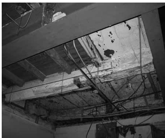
In mei 2006 is bij een interne renovatie de oude balkconstructie in het zicht gekomen. De zware eiken moerbalken zijn hier wit geschilderd.