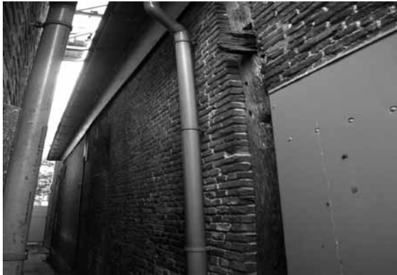
Zuidelijke zijgevel (rechter zijgevel) achterhuis met vakwerkrestanten. Rechts van de regenpijp is één van de houten vakwerkstijlen te zien. Bovenaan steekt de lip van een moerbalk door de stijl.