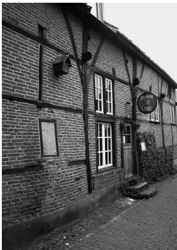
De zijgevel van het 17 de -eeuwse vakwerkhuis aan de Bierstraat.