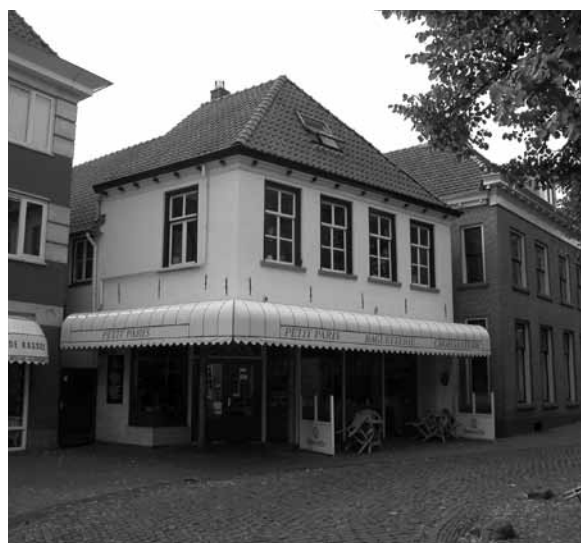
Molenstraat 2 vanuit het noordwesten, in 2004.