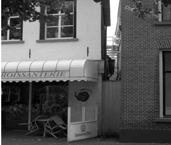
De osendrop of druipgang tussen Molenstraat 2 en 't Ei 1.