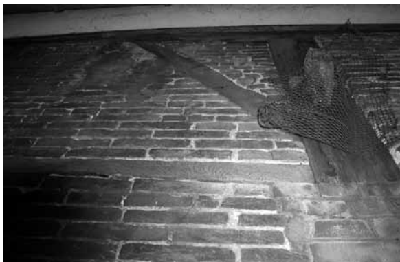
Detail vakwerkconstructie in zuidelijke zijgevel.

dwarsbalkje) aan. Verder is de oude gebintplaat te zien. Dit is de zware horizontale balk, die bovenlangs de gevel loopt en zo alle gebintstijlen aan elkaar koppelt. De verschillende houtverbindingen zijn door middel van houten toognagels tot stand gebracht. Halverwege de gebintvakken zijn in het metselwerk dichtgezette balkgaten zichtbaar. Vermoedelijk bevinden zich ook in de niet zichtbare linker zijgevel van dit bouwdeel nog vakwerkrestanten. Ook onderdelen van de kapconstructie op het achterhuis zijn mogelijk nog 17 de -eeuws.