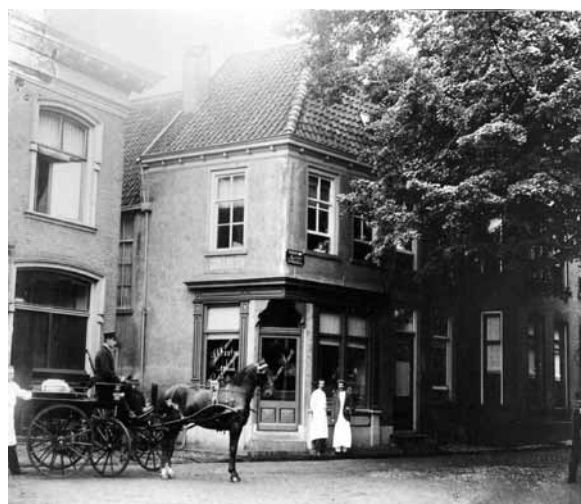
Historische foto, ca. 1900.

Uit het inventariserende onderzoek ten behoeve van de gemeentelijke monumentenlijst blijkt dat het om een in kern zeer oud pand gaat met een complexe bouwgeschiedenis. Vele verbouwingen hebben die bijzondere geschiedenis op het eerste gezicht onzichtbaar gemaakt, maar achter de 19 de -eeuwse voorgevel met zijn moderne pui geeft het huis zijn geheimen prijs. Oorspronkelijk moet het namelijk een vrij groot vakwerkhuis zijn geweest. Hierop wijzen de bewaard gebleven onderdelen van een waarschijnlijk 17 de -eeuwse eiken vakwerkconstructie in de rechter zijgevel van het achterhuis en de nog aanwezige ankerbalken in dit bouwdeel. De vakwerkresten, verborgen in de druipgang, bestaan uit één volledige en één halve eiken muurstijl met doorgestoken balkkop. Op de westelijke muurstijl sluiten nog een korbeel en een deel van een houten regel (een horizontale