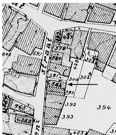
Kadastrale kaart 1860 met deel Blauwe Torenstraat, met nr. 582, de woning van de fam. Bol (zie pijl)