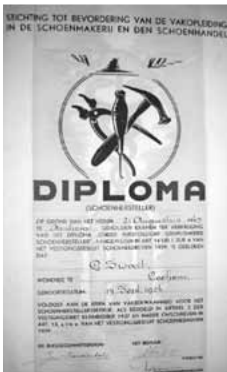
Diploma "Schoenhersteller A"