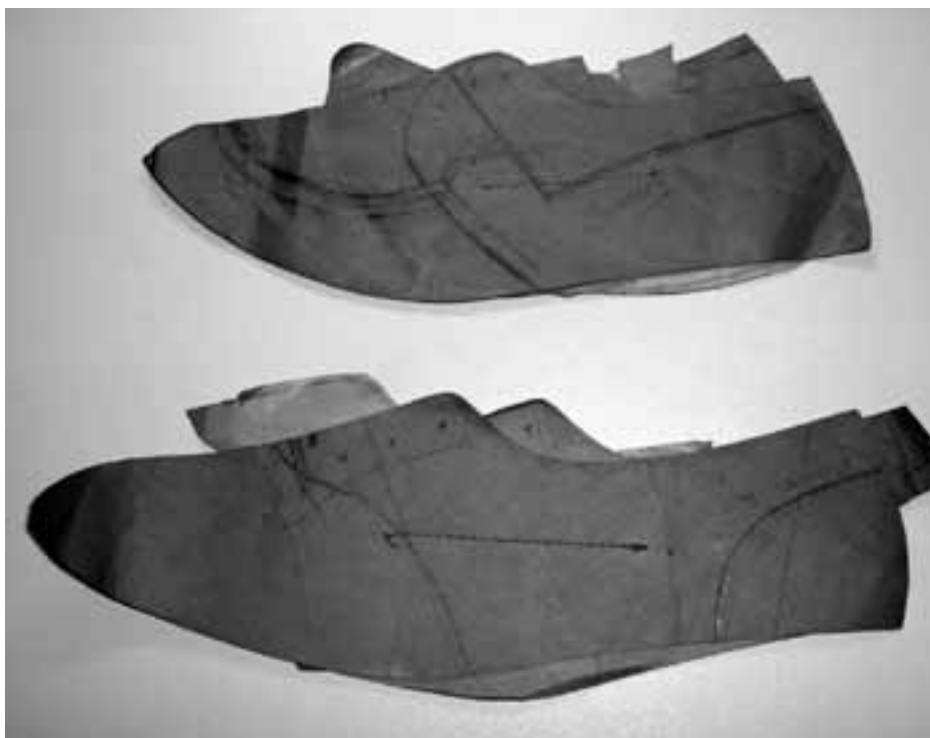
Voor iedere klant werd een basispatroon gemaakt; van daaruit werd een ontwerp getekend. Op de foto ziet u twee van deze ontwerpen.

Het "Orderboekboek" begint op 7 mei 1931. Interessant detail is, dat in de laatste kolom de prijzen