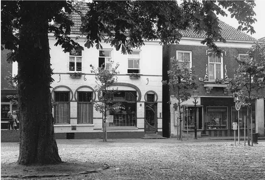
Afb. 1 - Foto gemaakt tussen 1950 en 1980

“De Wheeme met den Hoff laatstelijk door wijlen de Emeritus predikant B. Westenberg bewoond geweest, is door haar Edele Mogende op de 3 april 1777 aan de Magistraat der stad Loghem voor een somma van 995 daelders verkogt ende bij den Rendant ontvangen”.