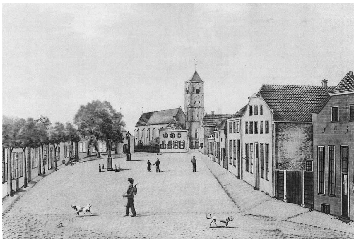
Afb. 2 - Prent van de Markt begin 19de eeuw met rechts het bewuste pand (anoniem coll. CeesJan Frank)

Een mooi voorbeeld hoe verschillende methoden van historisch onderzoek elkaar kunnen versterken en tot verrassende vondsten kunnen leiden.