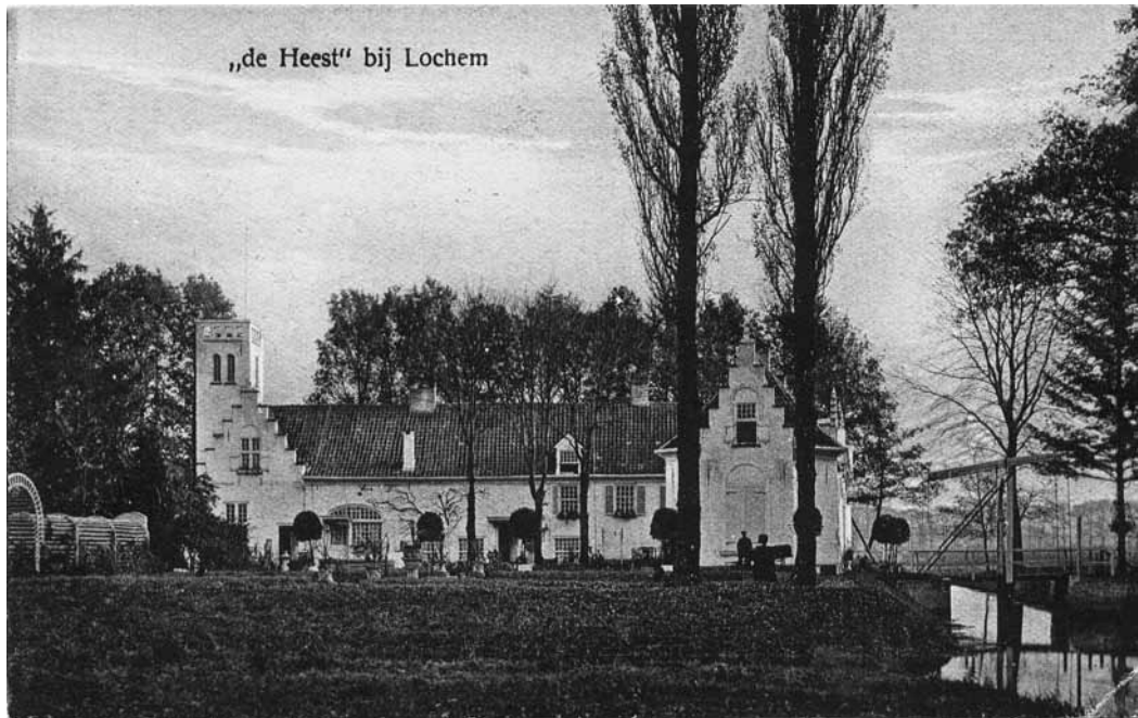
Deze ansichtkaart laat het door Pim Noothoven van Goor gecreëerde uiterlijk van 'De Heest' zien: met de witte muren, de trapegeveltjes, de duiventoren, de kleine ruitjes en de ophaalbrug.

via de aangebouwde gang was en is het mogelijk om van het woongedeelte van 'De Heest' binnendoor in het verbouwde deel van het huis (het oude koetshuis) te komen, zonder door het personeelsgedeelte te hoeven gaan.