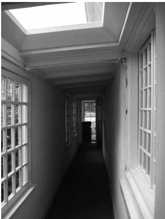
de aangebouwde gang van 'De Heest'