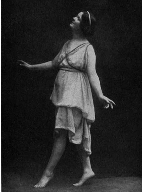
Isadora Duncan tijdens haar dans (foto uit 1903-'04)