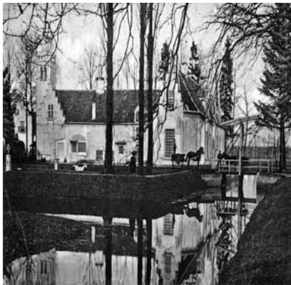
Zegel van Zutphen in groene was, 1655.

De zegels zelf zijn meestal van bijenwas gemengd met hars. In de middeleeuwen komen zeer veel rode en groene zegels voor. Het rood verkreeg men door de bijenwas te mengen met vermiljoen, menie of rode aarde, groen werd verkregen door toevoeging van kopergroen. Er zijn wel uitzonderingen op het gebruik van was-sen zegels. Zo gebruikte de pauselijke kanselarij loodzegels en zijn er sporadisch goudzegels gebruikt door keizers in de 12 e en 14 e eeuw.