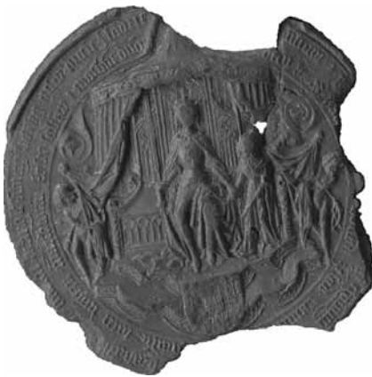
Zegel van rode was uit 1487. De zegel is van Roomskoning Maximiliaen en Philips.

Oud Archief Zutphen, inventarisnummer 1510.