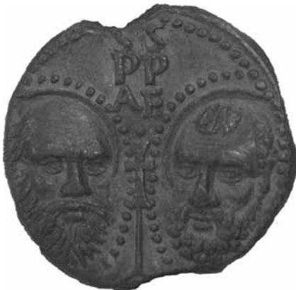
Pauselijke zegel van lood. Paus Sixtus, 1476.

Oud Archief Zutphen, inventarisnummer 1377, regest 1205