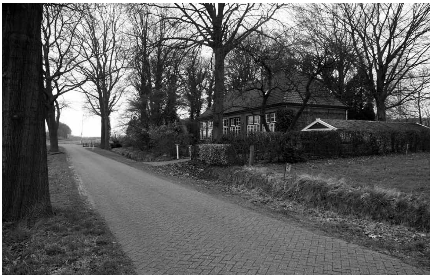
Februari 2008; de voormalige Openbare School te Groot Dochteren wordt nu particulier bewoond.

Een weg die naar een dorp of stad loopt, draagt vaak de naam van die plaats van bestemming. En andersom geldt hetzelfde: in Ruurlo loopt de Vordenseweg, in Vorden de Ruurloseweg. De Dochterenseweg echter loopt niet naar maar in Dochteren; om precies te zijn in Klein en Groot Dochteren. Het zijn buurtschappen bij Lochem. ‘Klein’ schijnt in werkelijkheid groter te zijn dan ‘Groot’. Maar dat zie je niet. Je ziet slechts een fraai landschap met hier en daar een boerderij. Net voorbij de kronkelende Berkel ligt rechts het gerestaureerde theekoepeltje van Staring. Het loodrechte Twentekanaal verderop verstoort de landelijkheid nauwelijks. En de spoorlijn Zutphen – Hengelo daarachter ligt er al sinds 1865. Wie voor het eerst de overgang nadert, richt zijn blik als vanzelf op het landhuis - Huize ’t Ross - recht voor zich. Maar de weg loopt langs het spoor naar rechts, vervolgens aan de andere kant. In de bocht naar links zie je een gebouwtje dat een school moet zijn geweest. Of is het dat nog?