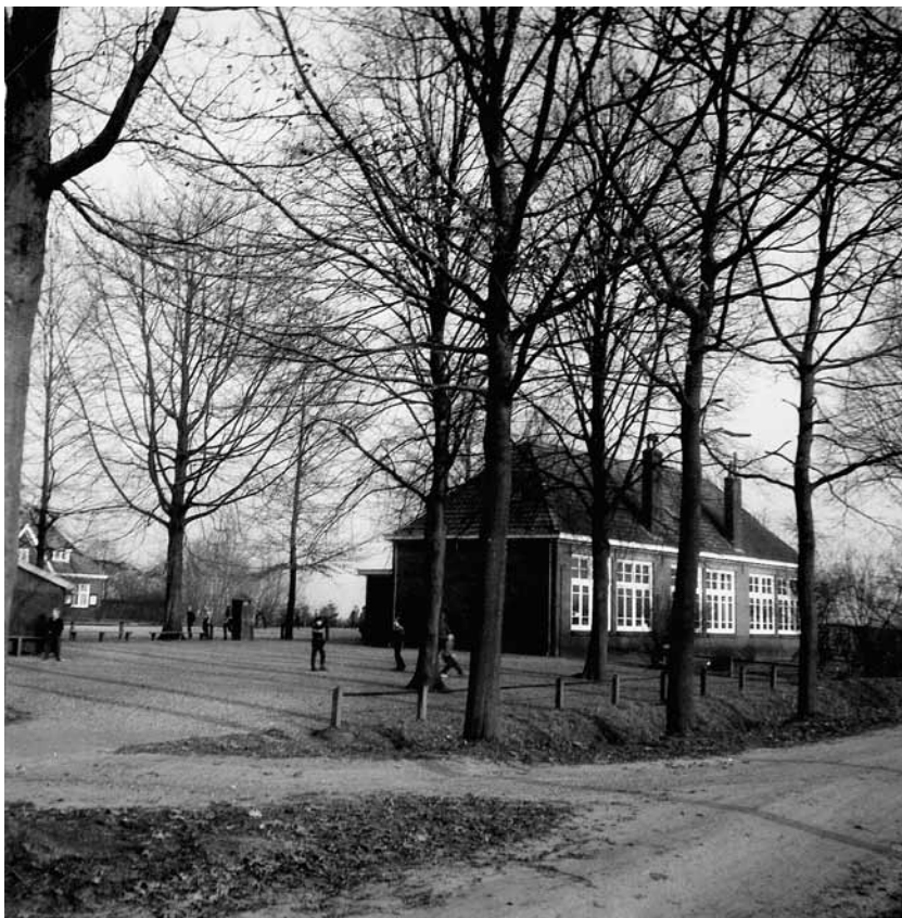
Herfst 1969, de school hier nog met pomp en met schoorsteen. De weg is ook nog niet bestraat.