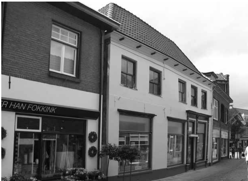
Voorgevel van Walderstraat 31-33

Het tegenwoordige winkelpand aan de zuidelijke zijde van de Walderstraat bestaat uit twee oude huizen, die