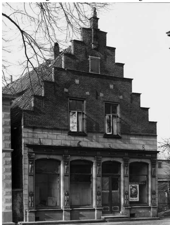
Het voormalige Richtershuis, Bierstraat 2

Het voormalige richtershuis is een volledig bakstenen huis op een diepe, rechthoekige plattegrond. Zoals de