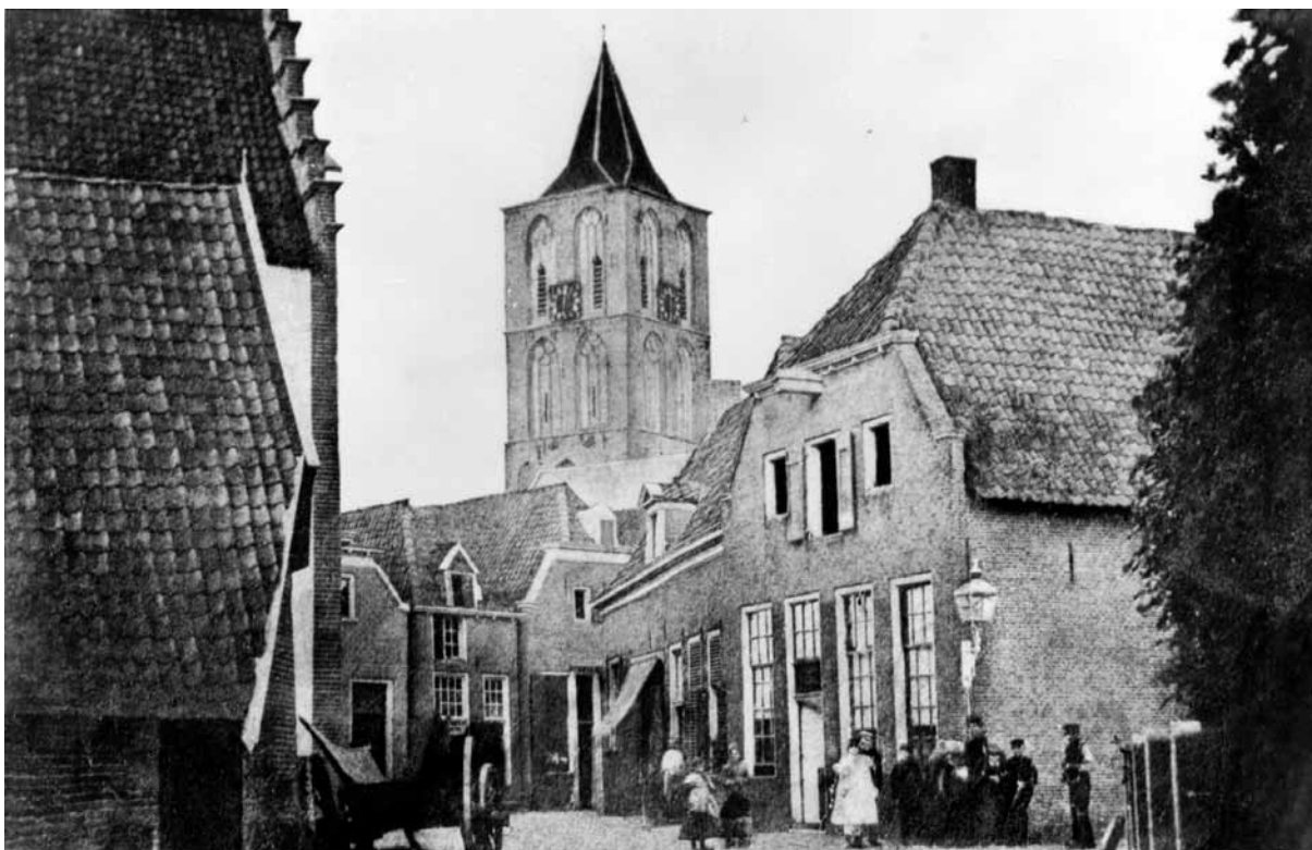
Historische foto van de Smeestraat, omstreeks 1865, met uiterst links de trapgevel van nr. 34