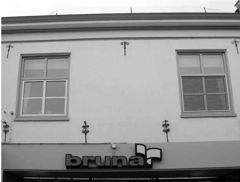
Details van de tegenwoordige voorgevel van Bierstraat 34. De fraaie krulankers zijn restanten van de zeventiende-eeuwse trapgevel