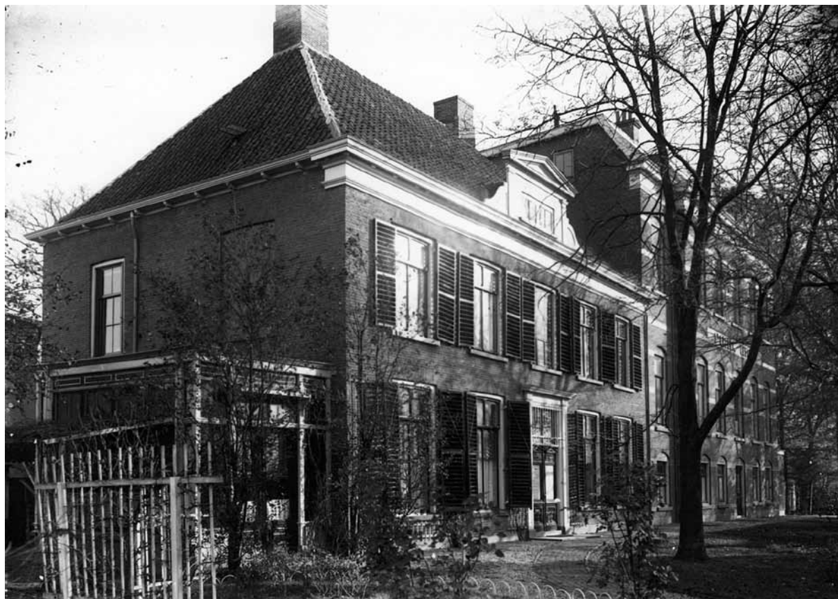
Het huis aan de Tuinstraat