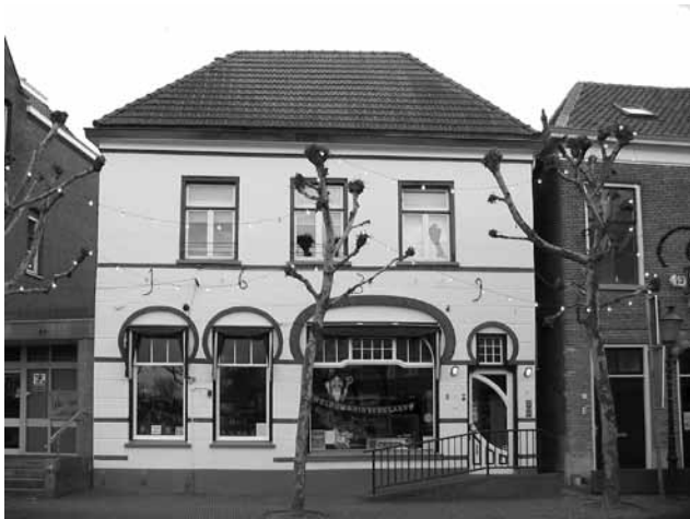
Voorgevel van het pand Markt 9. Boven de Jugendstil-winkelpui is het bouwjaar van het zeventiende-eeuwse huis te zien: 1639

2 uit 1638. De zeventiende-eeuwse trapgevel is al in het begin van de negentiende eeuw verdwenen, zo laat een prent van de Markt uit die tijd zien. De gevel is dan in blokverband gepleisterd, de trappen zijn weggenomen en het dak heeft aan de voorzijde een schuin schild (wolfeind) gekregen. Eind negentiende eeuw is het voorhuis met een verdieping verhoogd en rond 1905 is de huidige winkelpui aangebracht. Bij al deze verbouwingen bleven delen van het zeventiende-eeuwse huis intact, zoals in ieder geval de kapconstructie op het achterhuis en delen van het muurwerk. De gewelfkelder, hier onder het linker deel van het huis, is helaas dichtgestort. Ook de in het steegje zichtbare rechter zijgevel is van hoge ouderdom. Op grond van de afmetingen van de grote bakstenen die hier zijn toegepast en enkele andere bouwkundige details zou het wel eens kunnen