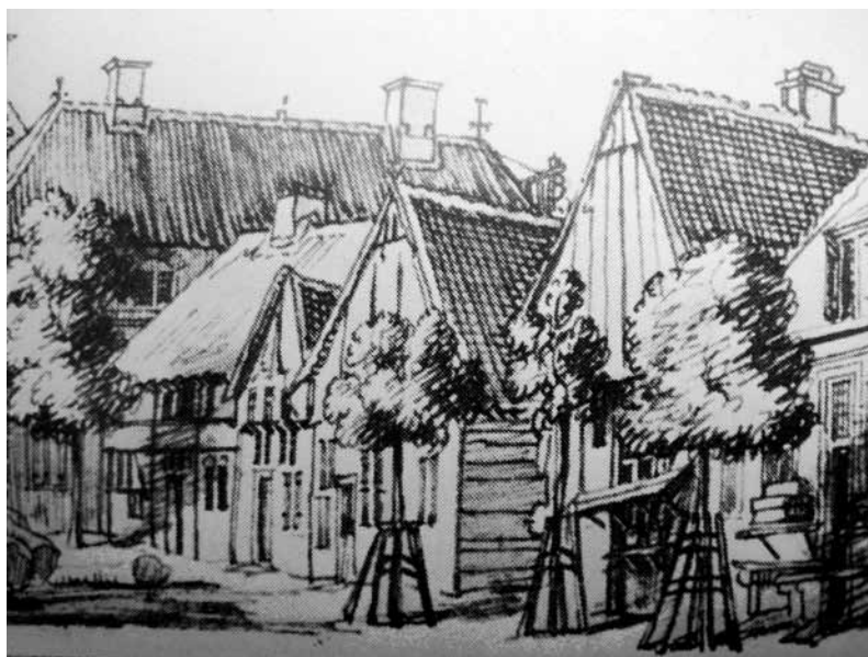
Houten huizen aan de Markt in Lochem. Detail van de tekening door Jan de Beijer uit 1743

een stevig houtskelet vormden. De muurvlakken tussen de houten stijlen en regels waren opgevuld met vlechtwerk, dat werd afgesmeerd met leem. Voor deze vullingen is in later tijd ook baksteen toegepast. Soms werden de zijgevels volledig betimmerd met houten planken, zoals op de tekening van de Markt door Jan de Beijer is te zien. De topgevels aan voor- en achterzijde waren ook geheel van hout. De daken werden met stro gedekt, een materiaal dat na de grote stadsbrand van 1615 van overheidswege zoveel mogelijk werd geweerd 1) . De stad Lochem verstrekke zelfs subsidies voor het gebruik van pannen, om daarmee de na de brand nieuw opgetrokken huizen een stuk brandveilig te maken. Uit de historische bron-