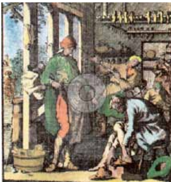
Jan en Kasper Luiken: "19 De Schoenmaaker: Siet op het middel niet, maar daar het om geschiet"

In 1604 komen de Gildebreders bij de "burgemesteren ende raedt der stadt Lochem" omdat ze hun Gildebrief bevestigd willen zien. Er staan namelijk "seeckeren twifelhaftige donckere punten" in, die opheldering behoeven. Ze nemen hun oorspronkelijke Gildebrief uit 1327 mee ("in originali" staat er) en nog een bevestiging van de brief uit 1514. Op basis daarvan wordt een reglement van negen punten opgesteld, zie Lochems stadsbestuur in de 17 e eeuw (p. 97-98) of, voor wie de