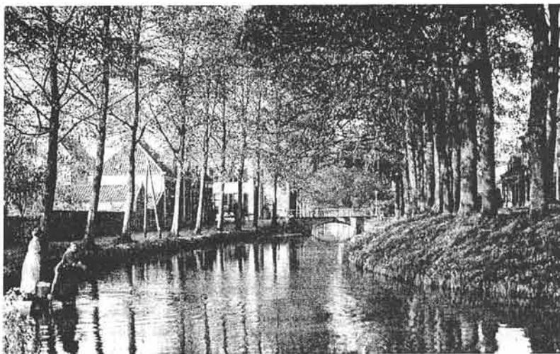
Ansichtkaart: Lochemse vrouwen doen hun was in de gracht. ± 1920.

"Met boete van ten hoogste f 3,- wordt gestraft ieder, die in de stadsgracht onkruid, krenge, afval of eenige andere onreinheid werpt, daarin ingewanden van slachtdieren reinigt of daarin dieren verdrinkt" .