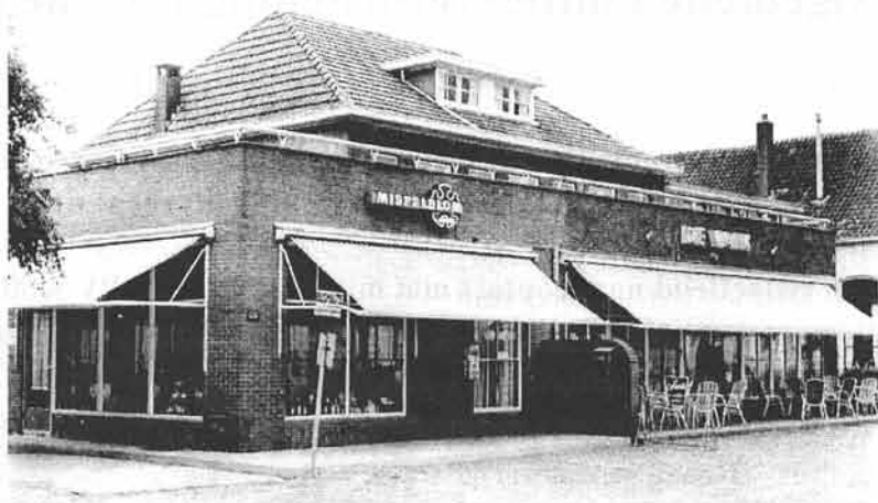
Café De Valk in de jaren 60 aan de Tramstraat te Lochem.

Tot 1926 bleven de binnengrachten intact. Een begin werd gemaakt met het dempen van de gracht aan de Noorderwal. Dit gebeurde op voorstel van de heer Franken (oud-fabrikant van de Gebr. Naeff Drijfriemenfabriek) tijdens de raadsvergadering van 15 maart 1926.