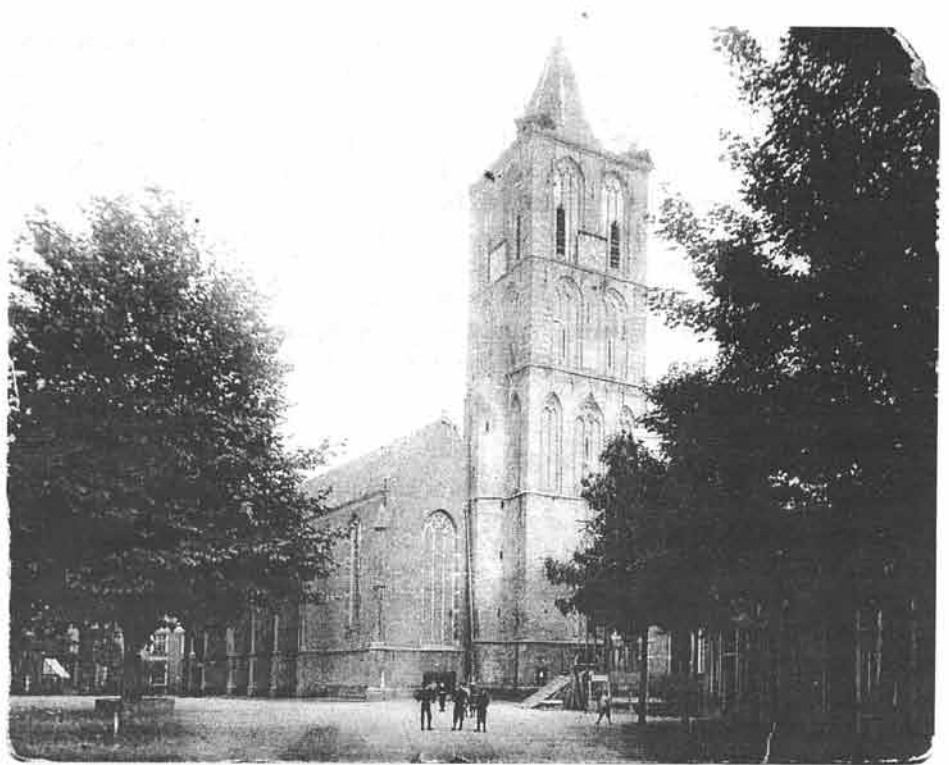
De Lochemse markt. 1898 - 1900