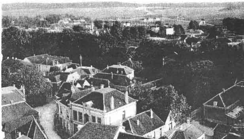
Ansichtkaart: Lochem rond 1900