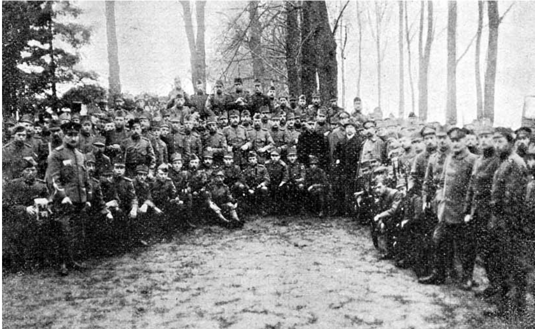
De wapens gereed, 's-Heerenberg 1920 (Uit: Maandblad, 29 mei 1923).