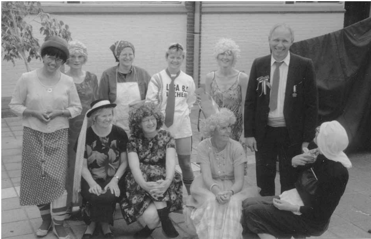
Leerkrachten tijdens de eindejaarsvoorstelling.

gevolg dat samen spelen en samen werken voor sommige kinderen wel eens moeilijk is. En wat te denken van een verhaal van iemand die vertelde dat hij vroeger soms op zijn stoeltje werd vastgebonden omdat hij zo beweeglijk was? (Dit is gelukkig nooit op de PH-school gebeurd.) Nu hebben we daar een "etiket" voor, daar zijn we goed in tegenwoordig, we noemden dat vroeger MBD-kinderen en in 2003 heten ze ADHD-kinderen en... ze worden niet vastgebonden!