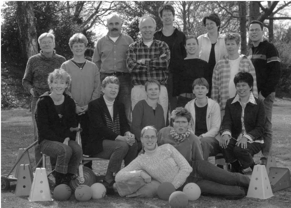
Huidige leerkrachten in 2003.