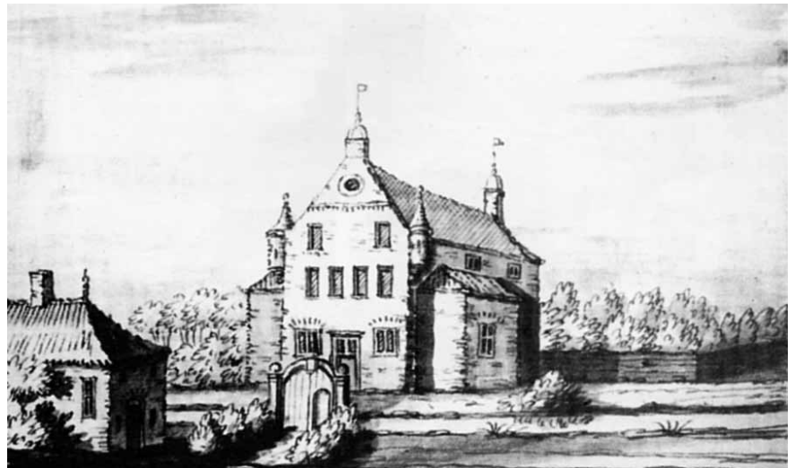
Huis Karssenberg door Frans Berkhuis (1720)