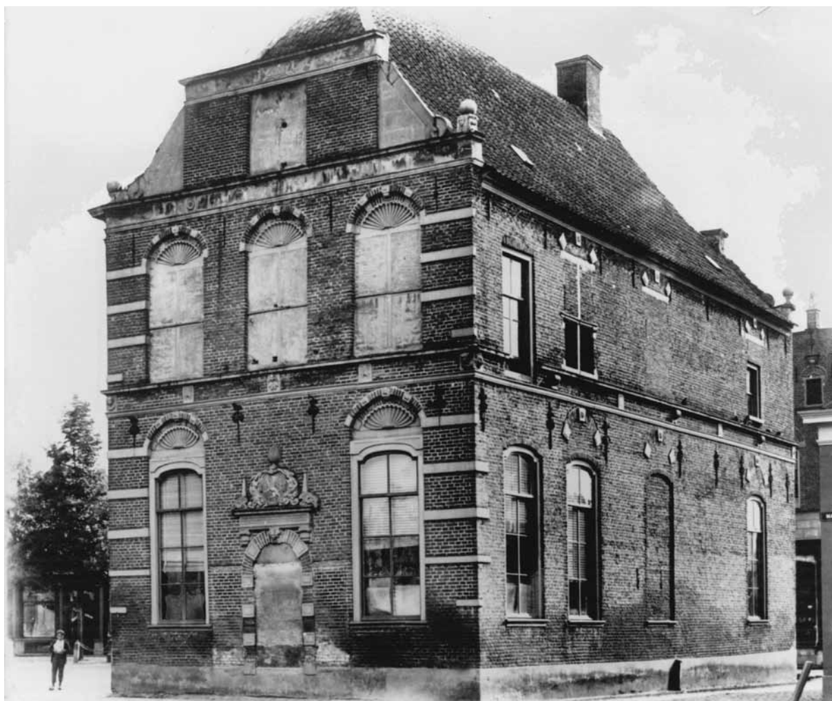
De oude voorgevel van het stadhuis vlak voor de restauratie van 1898.

De afgelopen maanden is er veel te doen geweest rond het oude stadhuis van Lochem. Het gemeentebestuur heeft zich gevestigd in een nieuw gebouw aan de Hanzeweg, waardoor het monumentale pand aan de Markt zijn functie heeft verloren. Wie gaat het gebouw een nieuwe toekomst geven? En wat moet de bestemming worden? Veel zorgen dus om het historische stadhuis, net als eeuwen geleden, want ook toen stond het stadsbestuur steeds weer voor belangrijke keuzes: herstel of afbraak, aanpassen of vernieuwen ?