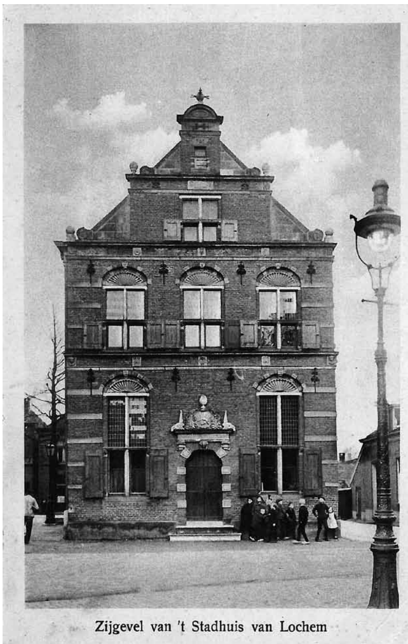
Zijgevel van 't Stadhuis van Lochem

Het stadhuis na de restauratie, met toegevoegde geveltop en gewijzigde dakhelling (ansichtkaart ca. 1900)