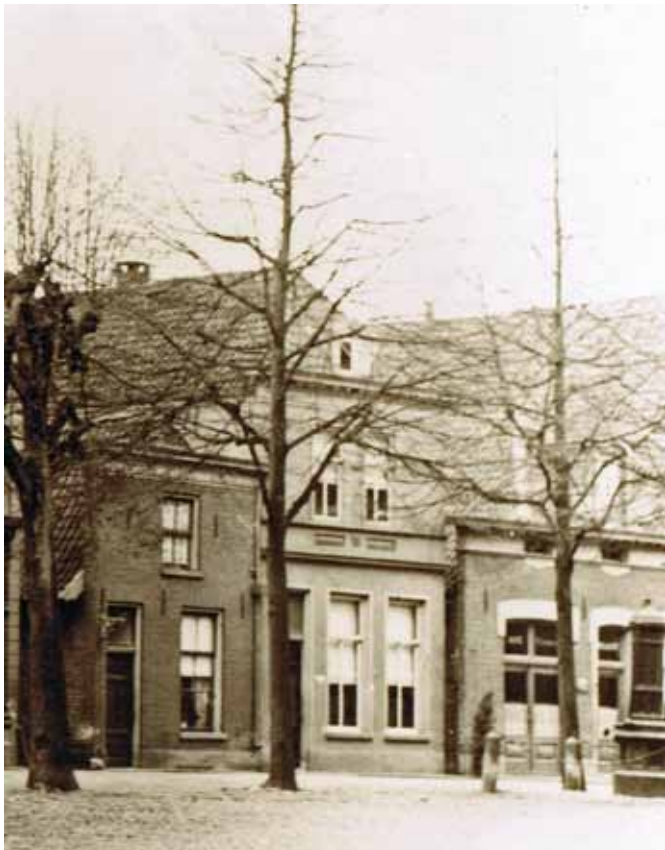
Bierstraat 6, het pand in het midden met de deur links en rechts twee ramen. Mogelijk zag de voorgevel er ongeveer zo uit in de tijd, dat de Postels er woonden en er hun herberg/logement hadden.

In het vorige Land van Lochem is het levensverhaal verteld van Christian Friedrich Postel, die als economisch vluchteling in onze streek terecht kwam. Frederik was in Lochem tapper, herbergier, logementhouder, landbouwer, koopman, waagmeester en deurwaarder en stichtte er een gezin. Over Frederiks kinderen en kleinkinderen gaat dit vervolgartikel.