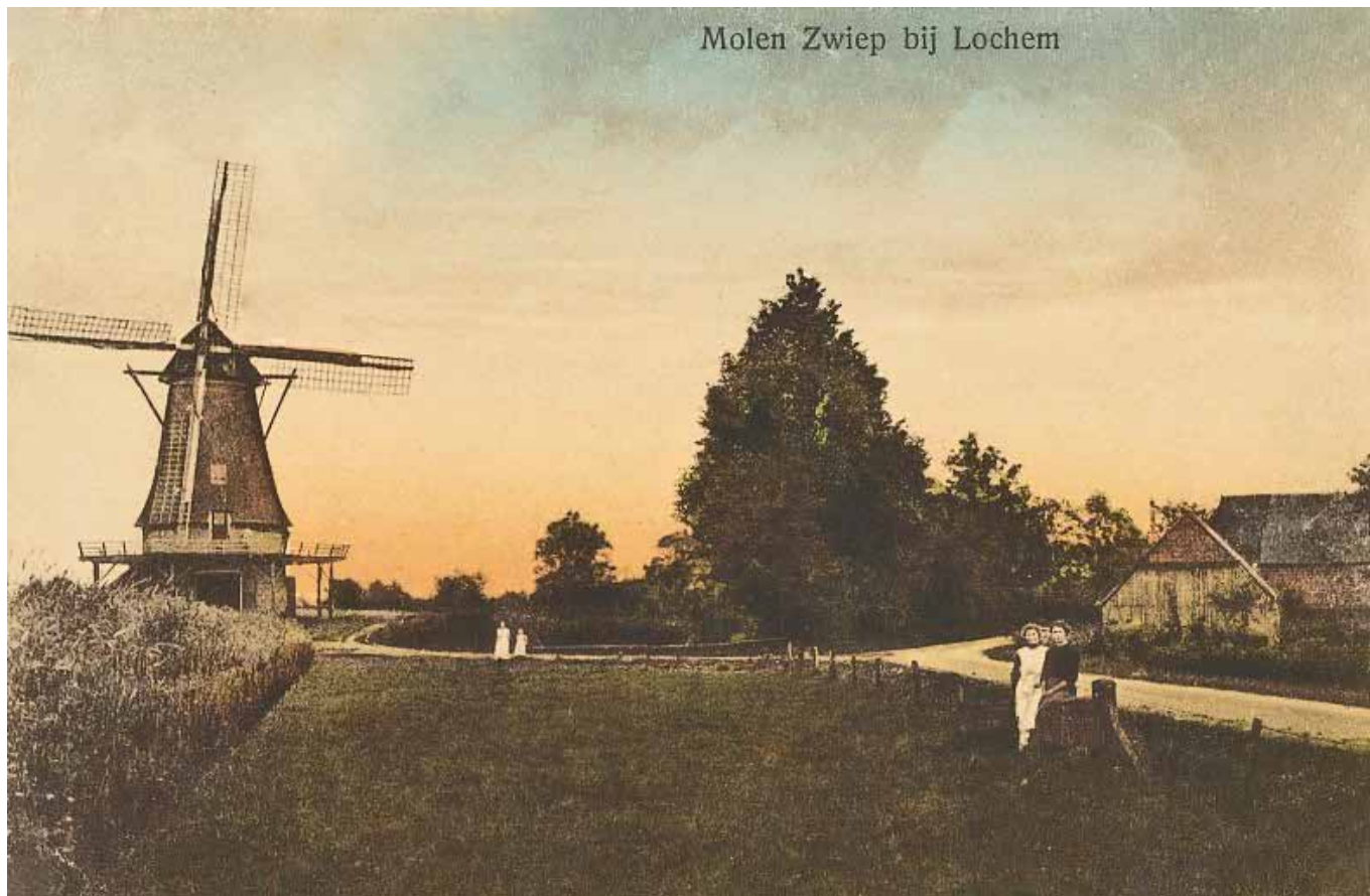
Molen Zwiép bij Lochem