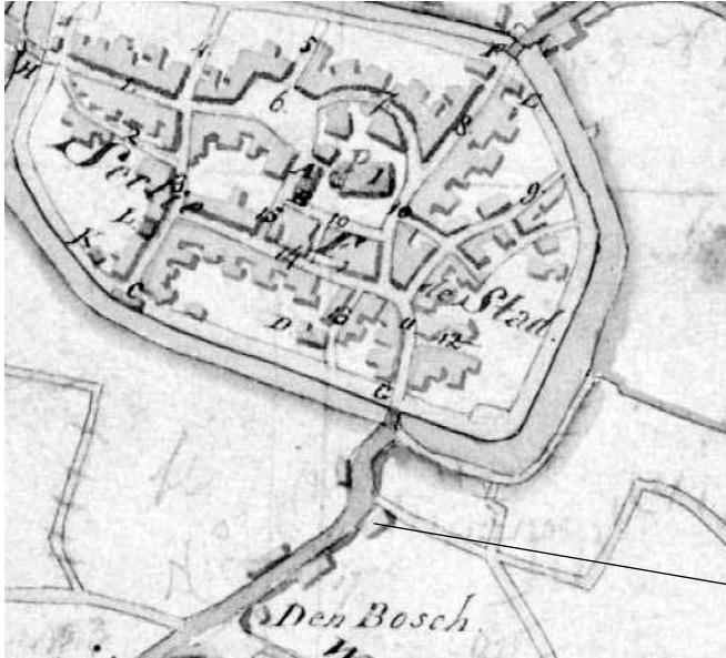
Kadastrale kaart 1832