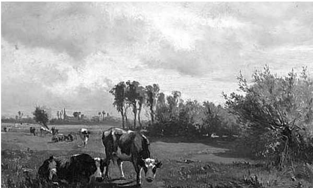
Gerard Bilders, Koeien in een zomers landschap, ca. 1860

Over de rol die Lochem in zijn leven en werk speelde, zowel het verlangen naar een verblijf hier als de botsing met de weerbarstige realiteit, zijn we goed ingelicht door de brieven en het dagboek van de schilder, die ook begiftigd was met een groot talent als schrijver.