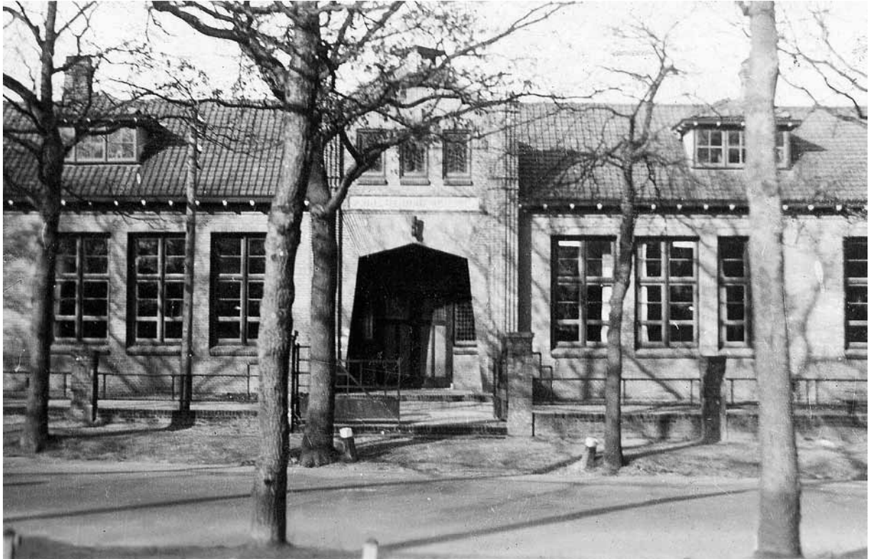
Een opname van het eerste gebouw van de Prins Hendrikschool. De school staat al honderd jaar op dezelfde lokatie aan de Zutphenseweg, tegenover de oude begraafplaats.