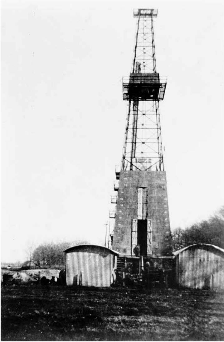
De boortoren aan de Koedijk.