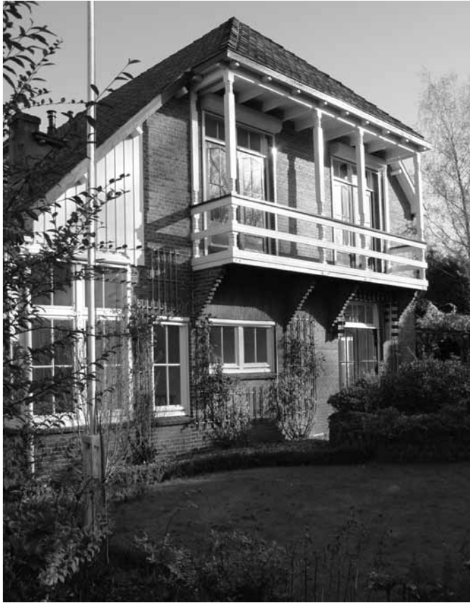
Het dubbele woonhuis aan de Frankenlaan heeft overeenkomsten met 't Sonnehuys.