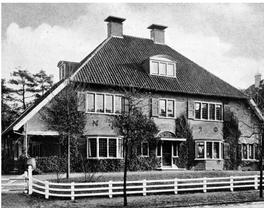
Landhuis d'Olijftak aan de Rossinilaan in Hilversum, 1904 door J.W. Hanrath.

Dit artikel is een bewerking en uitbreiding van de tekst over 't Sonnehuys, opgenomen in de in september 2012 verschenen Monumentengids Lochem , uitgave van het Gelders Genootschap, uitgeverij Matrijs en de gemeente Lochem. ISBN 978-90-5345-457-2. In de nog steeds bij de boekhandel verkrijgbare gids leest u alles over de rijksmonumenten en gemeentelijke monumenten in de gemeente Lochem.