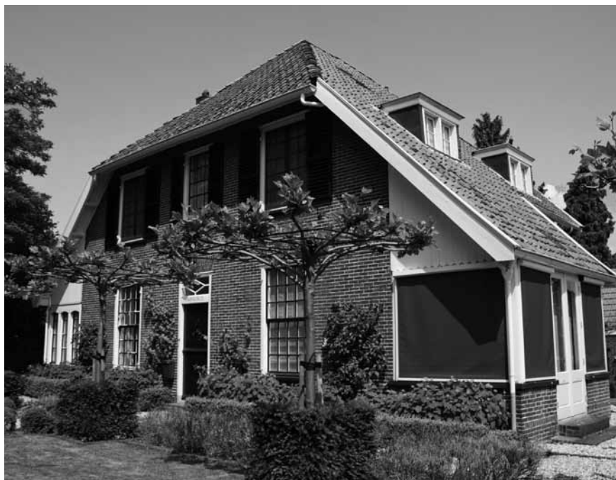
t Sonnehuys, tegenwoordige toestand (2012).

zidakvlakken en een kort dakschild boven de voorgevel), gedekt met ambachtelijke rode oud-Hollandse pannen en de in zeer fraai metselwerk uitgevoerde gevels. De voorgevel is op klassieke wijze symmetrisch ingedeeld. De vensters hebben ramen met kleine ruitjes en de ingang in de voorgevel heeft boven de deur een bovenlicht met bijzondere roedenverdeling. Een bijzonder element zijn de houten serres, die onder diep afgestoken dakschilden schuilgaan. Eén van de serres is door architect G.J. Postel in 1936 naar achteren uitgebreid. Het huis is een verkleinde versie van enkele grote landhuizen, die Hanrath rond 1905 in Hilversum ontwierp, zoals zijn eigen woning D'Olijftak uit 1904.