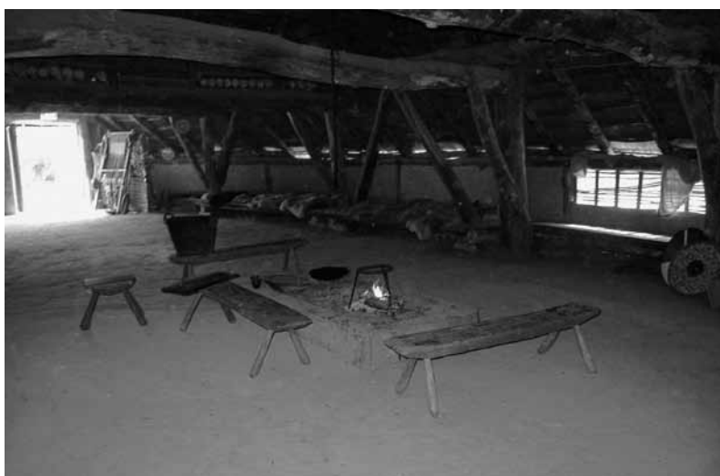
Indruk van het ruime interieur. (5)

In een beperkte periode van de bebouwing was er een hekwerk van naast elkaar staande palen als erfomheining of verdedigingswerk. Deze palissade heeft er niet altijd gestaan. De laatste boerderijsporen liggen over de palissadesporen heen. Toen was de omheining dus niet meer in functie.