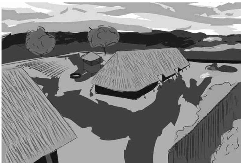
Frankisch erf met palissade, waterput en spieker. Gezien vanuit een standpunt achter “Welkoop Laren”. (Tekening van Robin Shields).

Tijdens de “Frankisering” (**) in de Karolingische tijd neemt de bewoning van het platteland overall toe. De nieuwe nederzettingen bestaan, net als in Laren, meestal slechts uit een of twee woonstalboerderijen met bijgebouwen en waterputten. Sterker dan voorheen worden de lagere flanken van de grote dekzandruggen en rivierduinen voor bewoning opgezocht. Door deze landinrichting komt meer landbouwareaal op de dekzandhoogte vrij en is er meer ruimte voor landbouw.