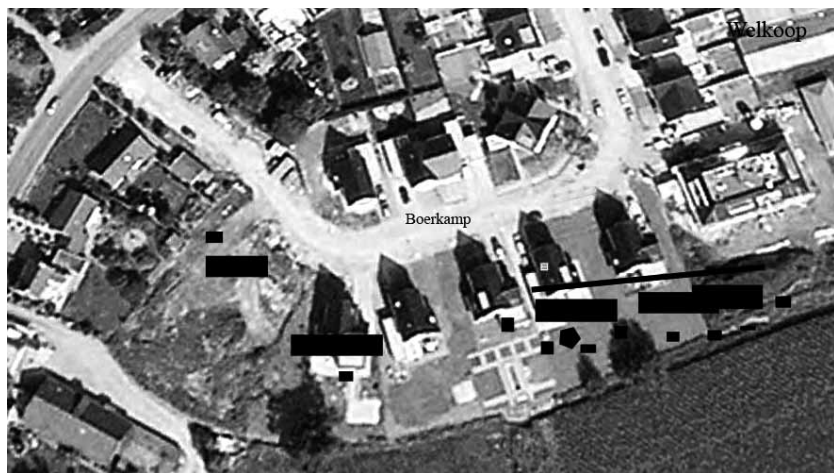
Een satellietfoto van de Boerkamp met de ingetekende locatie van de vijf boerderijen, enkele spiekers en een waterput. De streep geeft de erfomheining aan. In de rechter bovenhoek van de foto het gebouw van “Welkoop” Laren.

Alle boerderijenplattegronden zijn op het zuidwesten georiënteerd en bevinden zich aan de zuidkant van de huidige wijk. De nieuwe wijk is op een dekzandheuvel gebouwd waar de toenmalige boeren hun akkers hadden. In het zuidelijke lager gelegen grasland werd het vee geweid. De twee gebouwen aan de linkerkant vormden samen één erf. De gebouwen volgden elkaar op: als een gebouw was uitgewoond werd iets verderop een nieuw gebouw neergezet. Van de drie gebouwen aan de rechterkant overlappen twee boerderijen elkaar. Ook deze drie gebouwen volgden elkaar op. De grondsporen van de erfomheining konden slechts voor een deel worden gevolgd. Het is dus niet bekend hoe het erf precies werd afgeschermd.