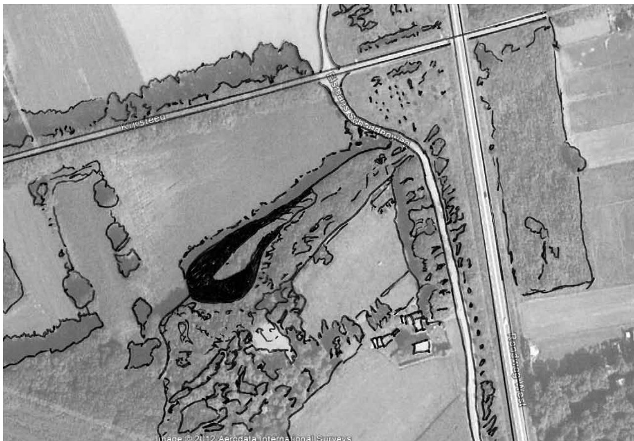
Een schets van de heuvel en de directe omgeving van de Kijksteeg