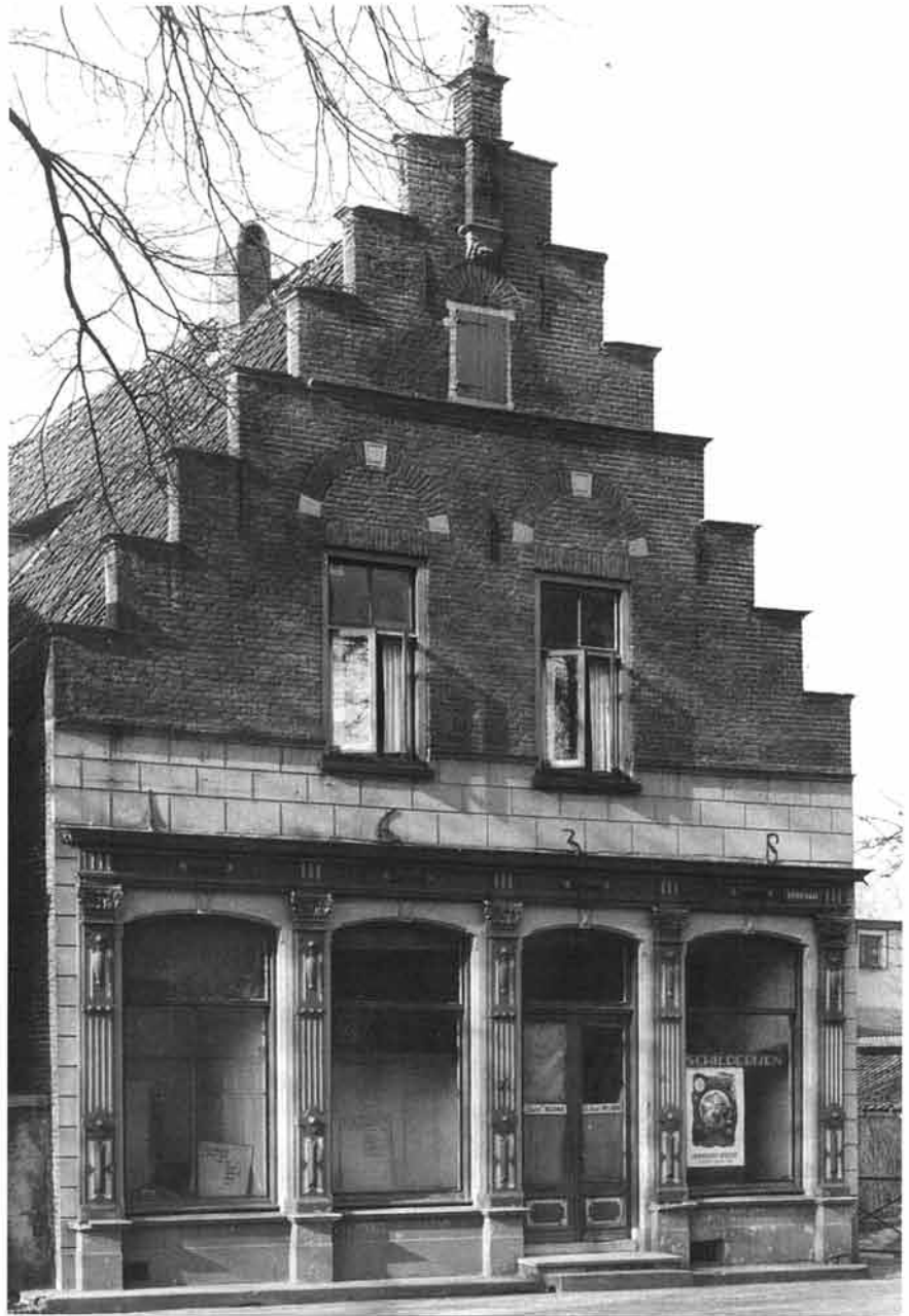
Het Richtershuis aan de Bierstraat

Boven dit stelsel van Stad en Scholtambt kenden we dan nog de figuur van Scholtis. Dit was eigenlijk een soort erebaan, een extra schakel tussen landsheer en plaatselijke bestuurders. Hij moest altijd van adel zijn en had enerzijds tot taak dat de afdrachten van het grafelijk bezit (de Hof) correct plaatsvonden en anderzijds was hij verantwoordelijk voor de orde en veiligheid van zijn Scholtambt. In