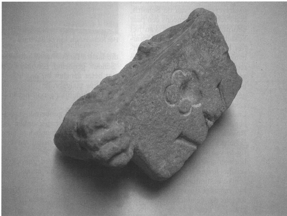
Zandstenen fragment van de oorspronkelijke trapgevelbekroning van het Richtershuis. Van de schilddragende leeuw is een van de klauwtjes zichtbaar en een gedeelte van het schild met de letter W.

Het zou misschien een goed idee zijn om, nu de gemeente Lochem eigenaar van het object is, het verleden te doen herleven en het pand voortaan weer Richtershuis te gaan noemen. De Stad is het ook aan zijn geschiedenis verplicht er voor te zorgen dat het gebouw in het kader van de herindeling niet meer aan particulieren wordt verkocht en dat alleen een historische bestemming wordt toegelaten.