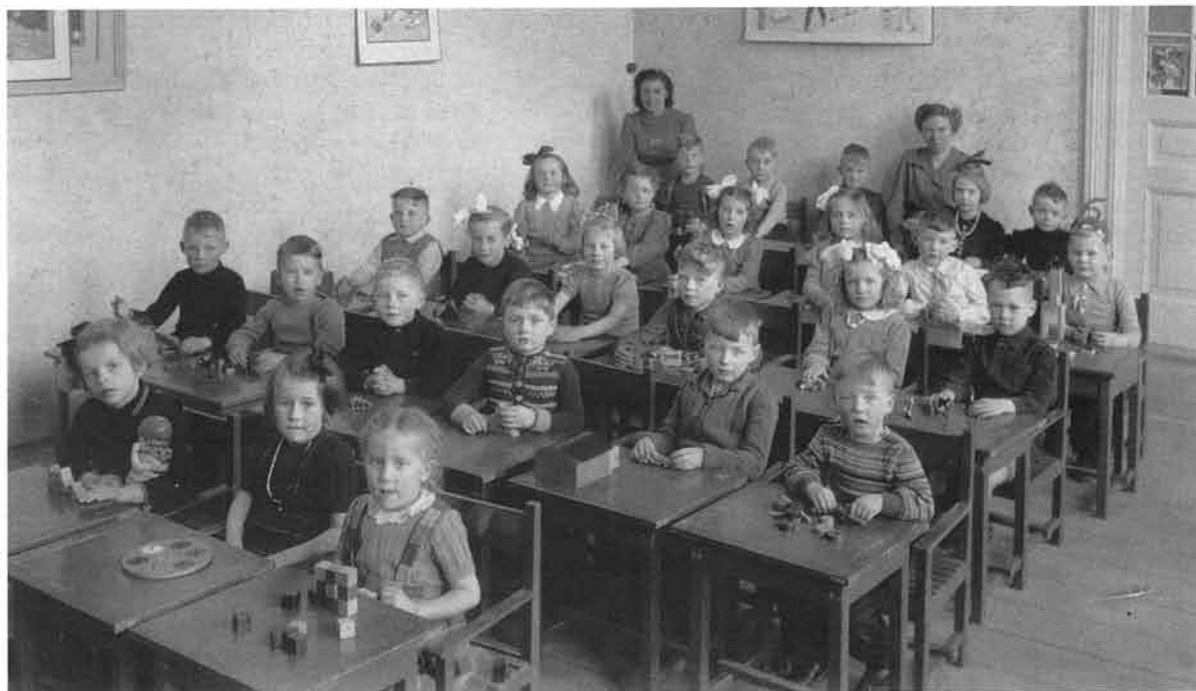
Klassenfoto uit 1949.