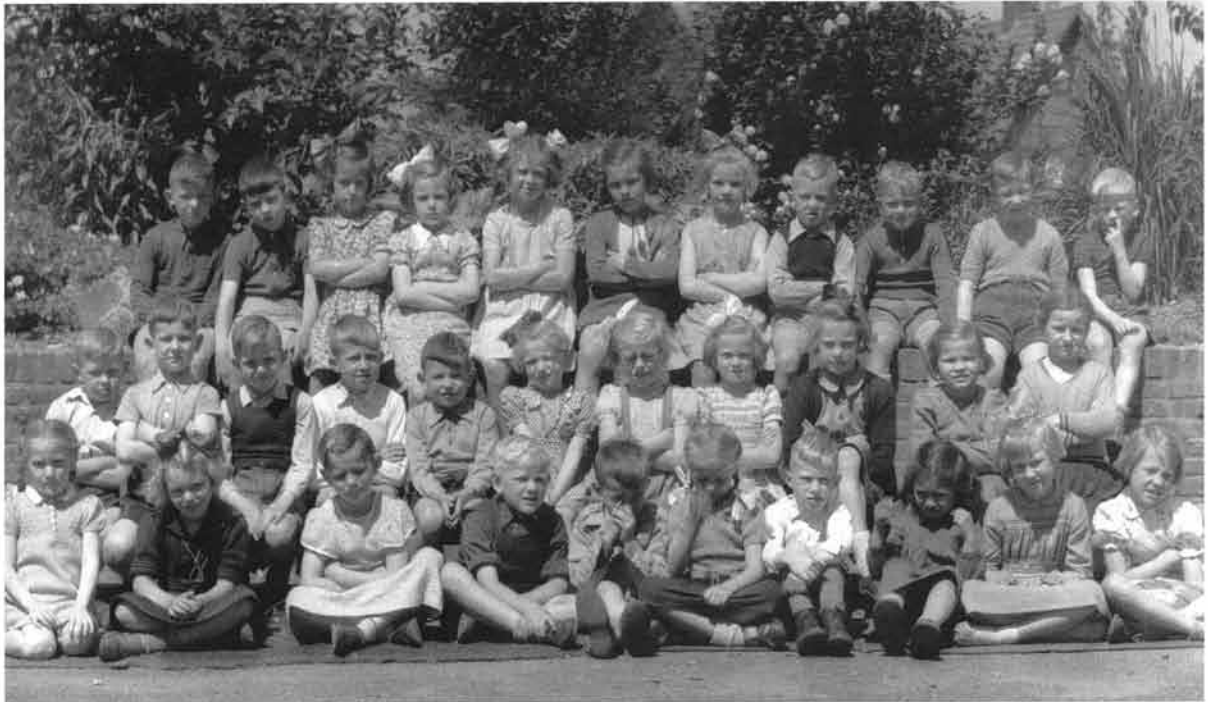
Klassenfoto uit 1951

Een Prins Hendrik Reisvereniging is toen nooit van de grond gekomen.