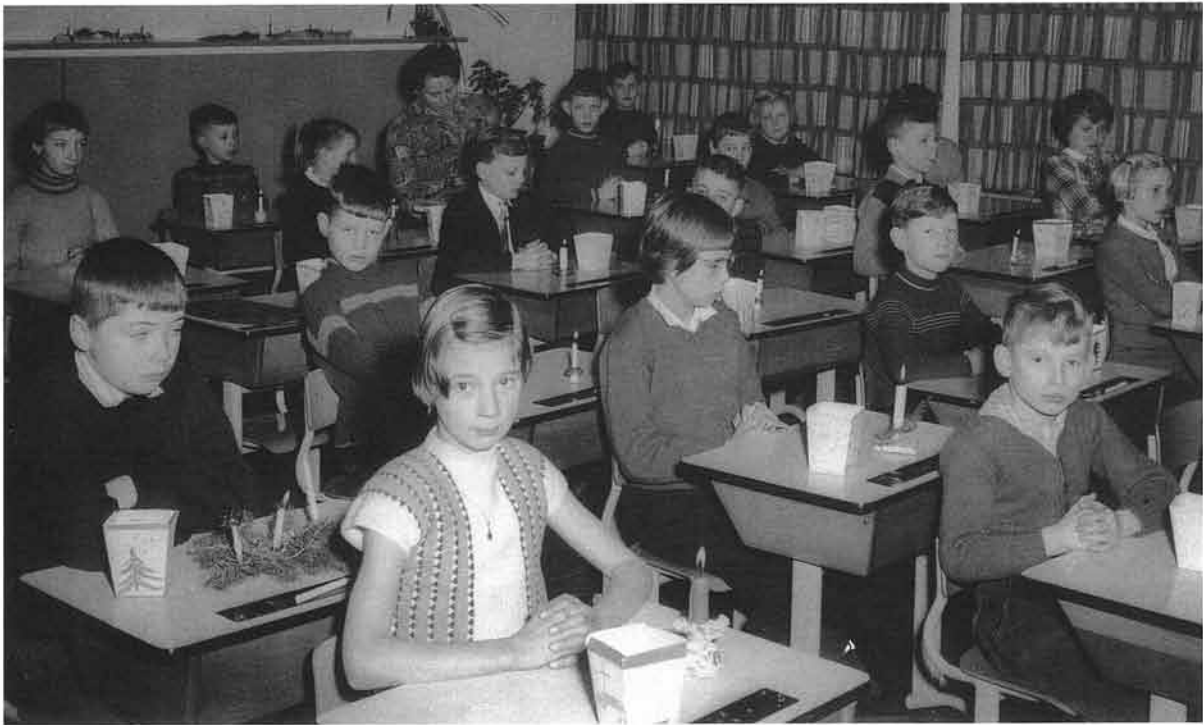
Kerstfeest in 1960

bleven slechts enkele fundamenten liggen en één muur overeind staan.”