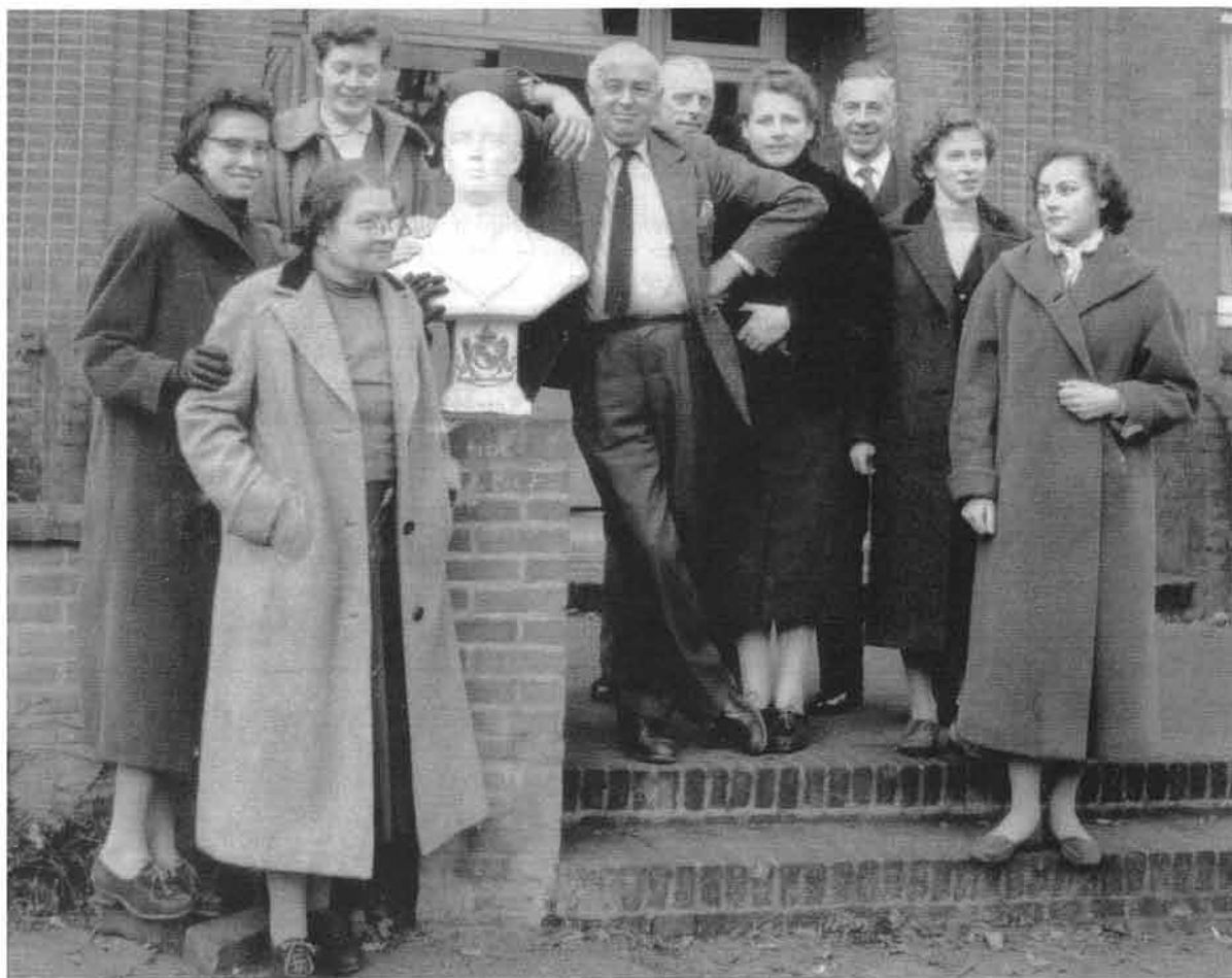
Leerkrachten in 1956

Onze belangrijkste wens is toen helaas niet ingewilligd. We hadden met klem gepleit voor een