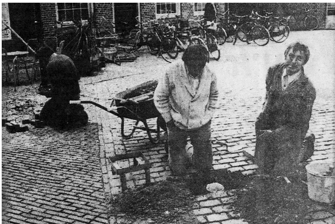
Voorlangs het postkantoor en de winkels aan de Markt te Lochem leggen stratenmakers een wandelpad aan van gele stenen.

De plaatselijke krant kopte in die dagen: