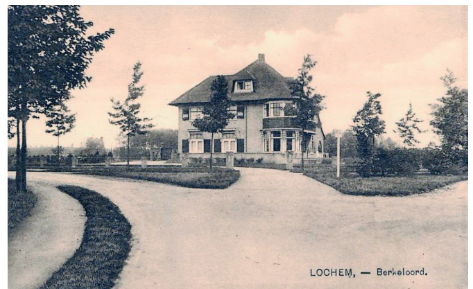
Marinus Naefflaan 34, een ontwerp van architect G.J. Postel

Kriegs-Lazarett. Voor één van deze villa's moet het houten bord uit de collectie van het HG gestaan hebben, waarschijnlijk voor Marinus Naefflaan 34. Op het dak was een groot wit laken gespannen met een rood kruis erop. Na de bevrijding zouden de geallieerden zo'n zelfde laken spannen op de Cloese, waar zij hun gewonde militairen verzorgden en lieten aansterken.