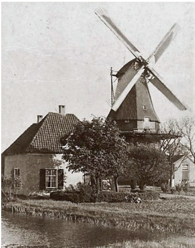
Molen 'de Hoop' aan de Berkel