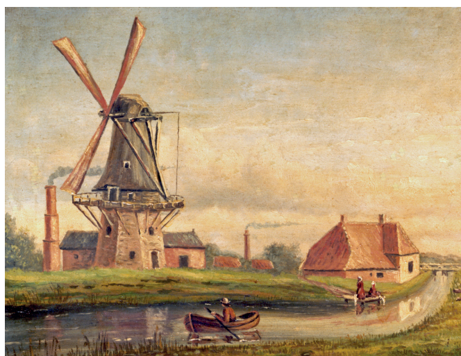
De bekende schilder Gradus ten Pas schilderde omstreeks 1894 de molen 'de Hoop' in zijn kenmerkende primitieve stijl.

Ga dan eens naar onze website www.hglochem.nl en 'zoek' naar de pagina 'Wie? Wat? Waar? Waarom?'